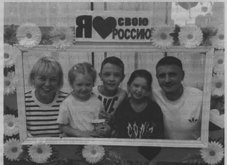
Материалы полосы подготовила Наталья ХАЛМАНСКИХ.

Пока живут в деревне такие замечательные люди, не померкнет родник творчества, трудолюбия, инициативы, который ведет нас к новым достижениям на жизненном пути. А значит, будет жить деревня!