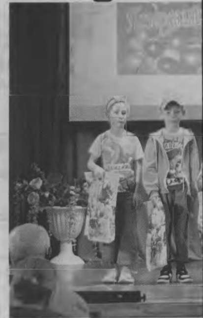
14 июня 2025 г. прошел посёлка Кировский». Он деревень и сел.