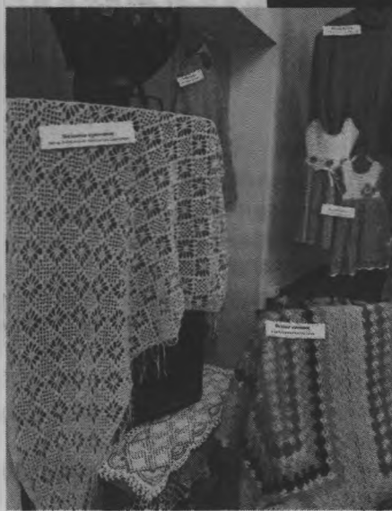
▼ Выставка работ кодочиговских мастериц.