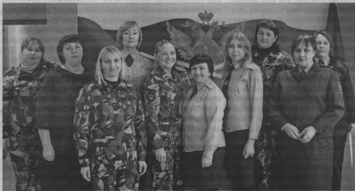
▲ Члены женсовета.

Вот уже более 20 лет в учреждении функционирует женсовет. В его состав входят самые активные и трудолюбивые женщины коллектива, пользующиеся заслуженным авторитетом, ува-