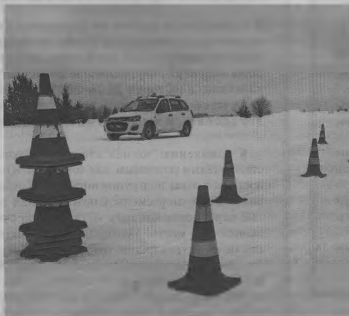
▲ Здесь нельзя ошибаться.

Да, этот день я решила провести с учениками и мастером по вождению. Вспоминаю себя, впервые севшую за руль автомобиля, улыбаюсь, объясняя, почему я тут, уговаривая не обращать на меня внима-