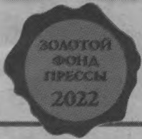
Фото Ю. Юсупова