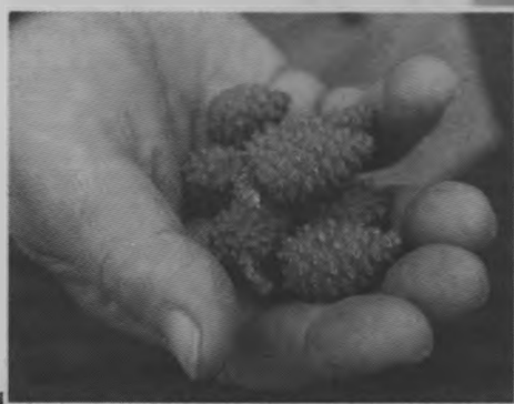
Молодые сосновые шишки с малой родины - хорошее лекарство от всех недугов.

...Воспоминания, сбивчивые и неупорядоченные, нахлестывают друг друга, Александр и Людмила то замолкают, то начинают говорить быстро и весело, то вдруг в голосе кого-то из них появляются нотки грусти. Как давно это было, а кажется, что только вчера.