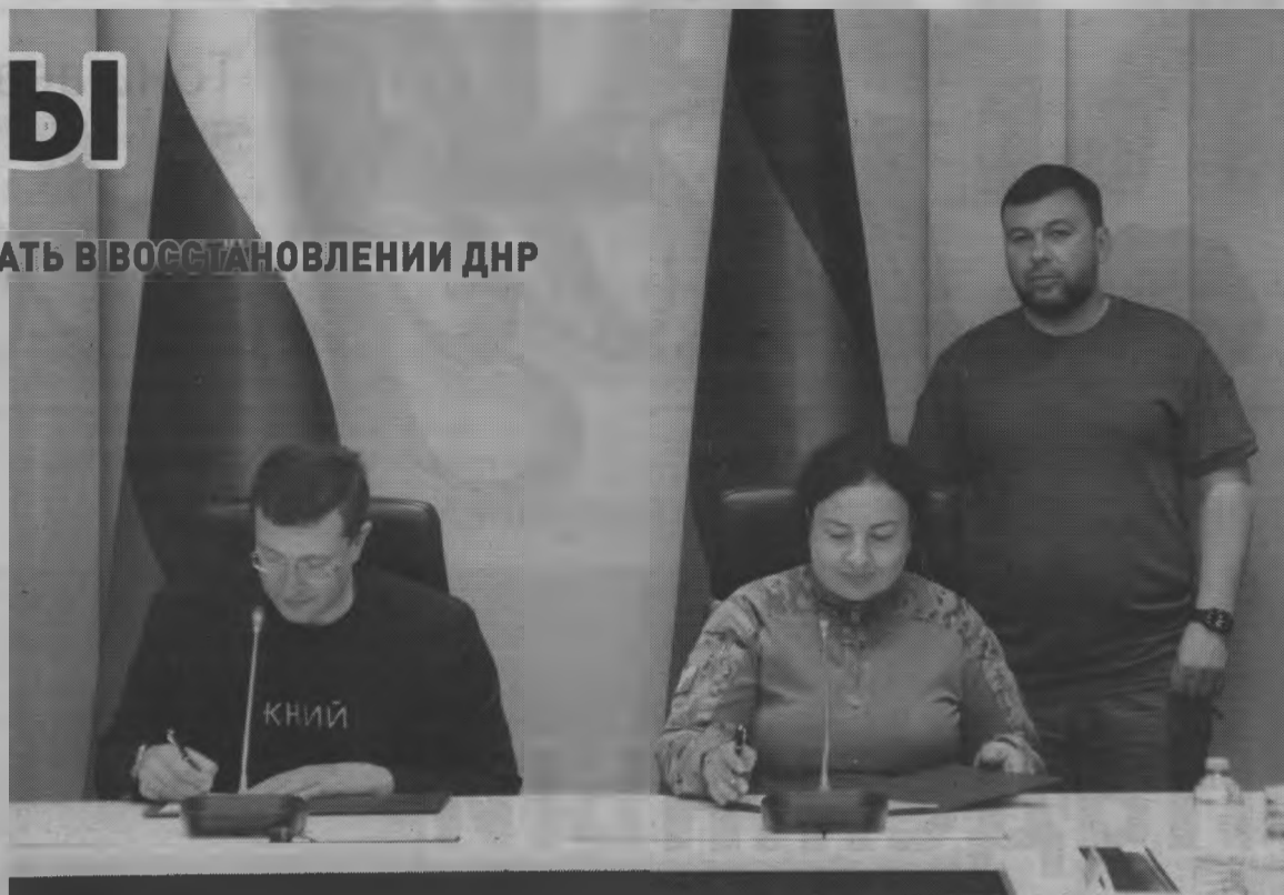
▲ Глеб Никитин и Виктория Жукова подписали соглашение о сотрудничестве.

В центре внимания – и подготовка к осенне-зимнему сезону населенных пунктов Большого Харцызска, в который входит город Харцызск и близлежащие села. Нижегородские специалисты провели анализ всех систем жизнеобеспечения, опреде-