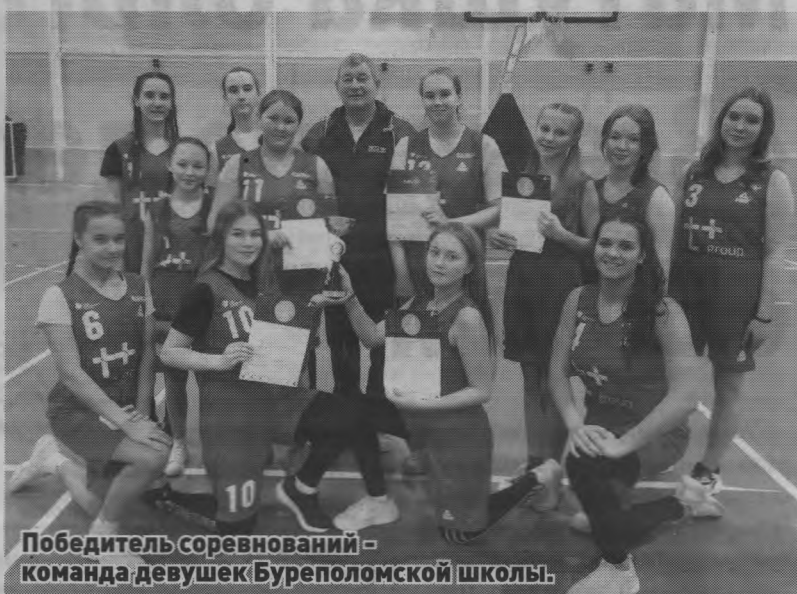
Победитель соревнований – команда девушек Буреполомской школы.

На спортивной площадке ФОКа «Старт» прошёл муниципальный этап Всероссийских соревнований по баскетболу «КЭС-БАСКЕТ». В этих соревнованиях приняли участие учащиеся 7-11 классов, девочки и мальчики 2004 года рождения и моложе, четыре школьные команды мальчиков и пять школьных команд девочек.