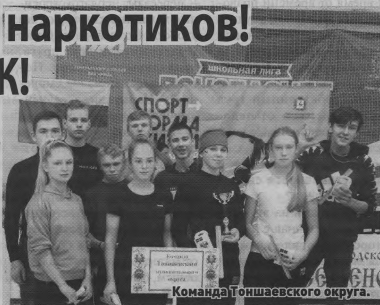
Команда Тоншаевского округа.

В последний день уходящей осени в Семенове прошла спартакиада среди подростков в возрасте от 14 до 17 лет под названием «Спорт для всех». Данное мероприятие носило профилактический характер, имело антинаркотическую направленность и было приурочено ко Дню борьбы со СПИДом - 1 декабря.