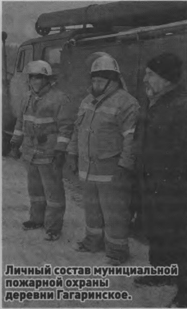
Личный состав муниципальной пожарной охраны деревни Гагаринское.

- Вот тогда мы и решили, что подготовка должна быть