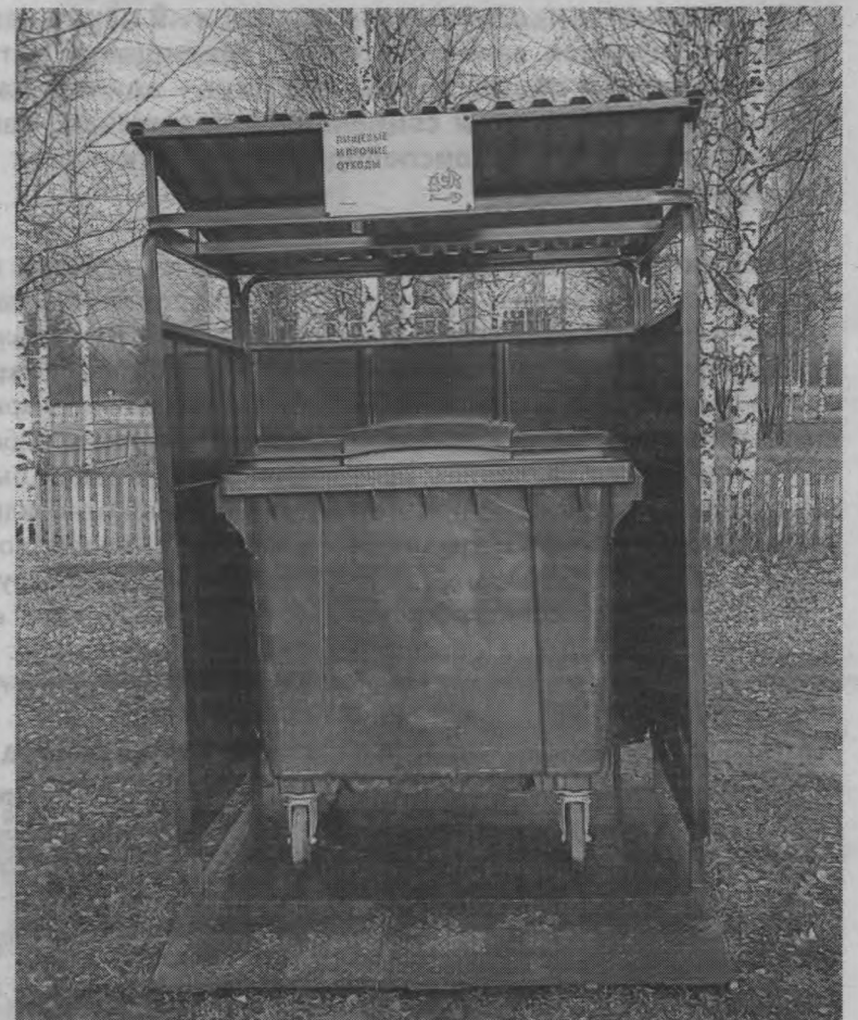
Материалы полосы подготовила Валентина ШИШКИНА.

Все контейнеры установлены на твердое металлическое основание и огорожены, чтобы мусор не разлетался по прилегающей территории. Средства на их обустройство выделены из местного бюджета.