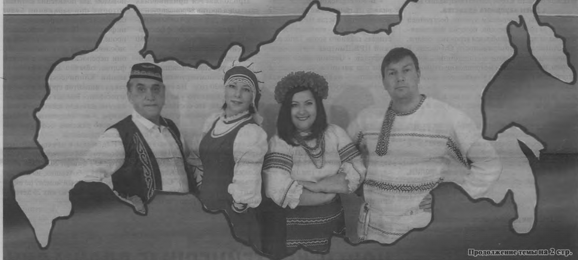
Продолжение темы на 2 стр.

Коллектив ДК «Юбилейный»