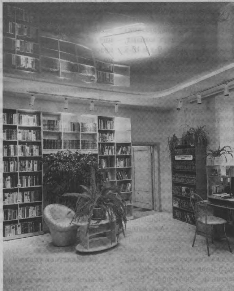
Материалы подготовила Елена МИХАЛИЦЫНА

- Помещение абонемента давно требовало ремонта. И вот, наконец, у нас новый зал: здесь выровнены стены, заменены полы, установлено новое освещение и новый натяжной потолок, приобретена новая мебель. Мы очень старались создать комфортные условия для читателей, и на первом плане для нас – грамотная организация библиотечного пространства. Зал теперь состоит из трех зон: кафедра, где производится выдача книг, тихая зона для чтения «Читаем классику» и основная – непосредственно книжный фонд. Мы еще не окончательно благоустроили зал, работы будут продолжены. Однако и сейчас здесь уже стало гораздо уютнее, светлее и комфортнее.