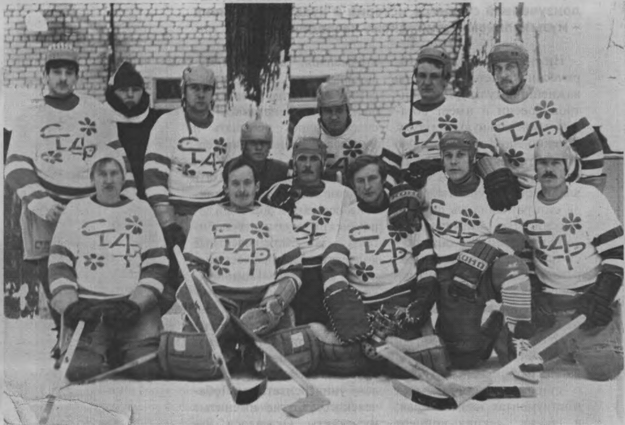
Хоккейная команда «Старт». 1988 год.

В результате состоявшихся переговоров Тоншаевскому спорткомитету безвозмездно передали 24 комплекта защитного снаряжения для хоккеистов, включая два вратарских комплекта, а также 44 игровых свитера. Невероятный подарок для тоншаевского хоккея!