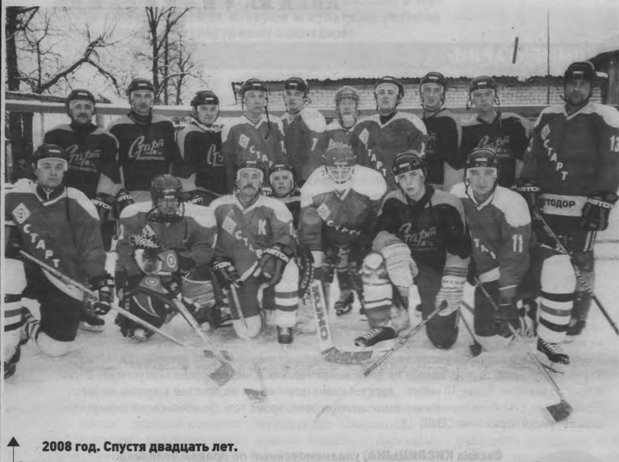
2008 год. Спустя двадцать лет.