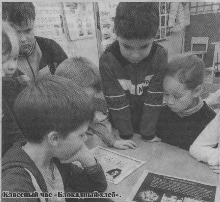
Классный час «Блокадный хлеб».

Ключевым символом Всероссийской акции памяти «Блокадный хлеб» является кусочек хлеба весом в 125 граммов — именно такая минимальная норма выдачи хлеба на человека в день была установлена в самый трудный период блокады. 250 граммов получали работающие люди один раз в 24 часа. Цена такой пайки хлеба стоила целой жизни.