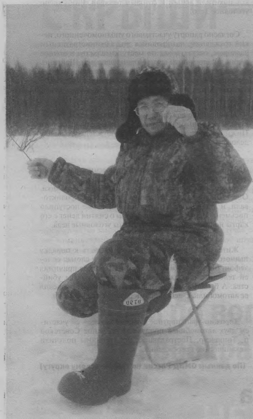
Вот она, рыбка!

завезли для развода мальков. Тут далеко ходить не надо, из соседней Шахуньи ездят к нам на рынок карпов продавать, так эти продавцы и мальков могут привезти. А то у нас и порыбачить негде.