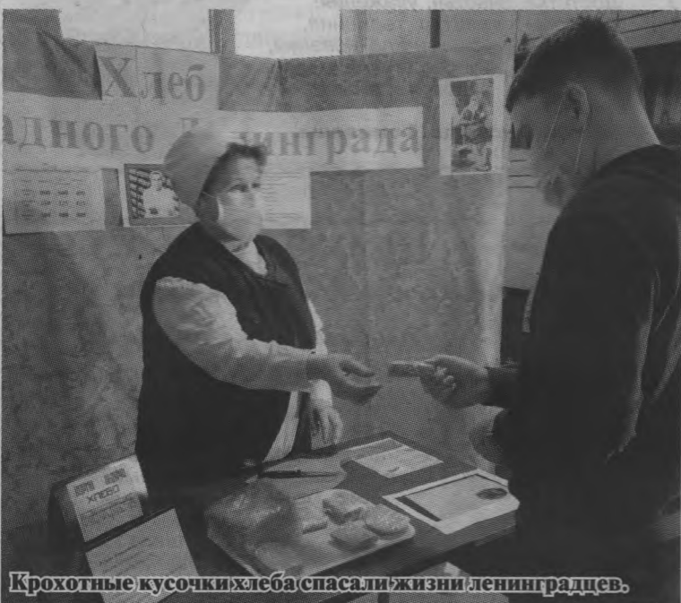
Крохотные кусочки хлеба спасали жизни ленинградцев.

Сотрудники Центральной районной библиотеки провели для учащихся Тоншаевской вечерней (сменной) школы поэтическую композицию «Муза блокадного Ленинграда», посвященную Ольге Берггольц. В читальном зале библиотеки оформлена книжная выставка «Блокадной вечности страницы».