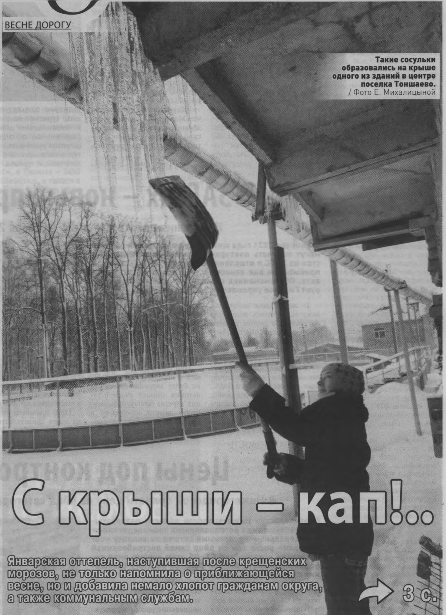
Такие сосульки образовались на крыше одного из зданий в центре поселка Тоншаево.