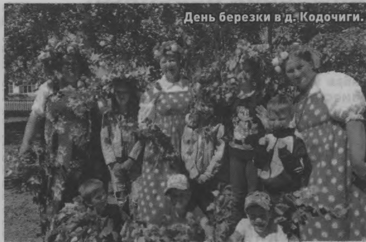
День березки в д. Кодочиги.