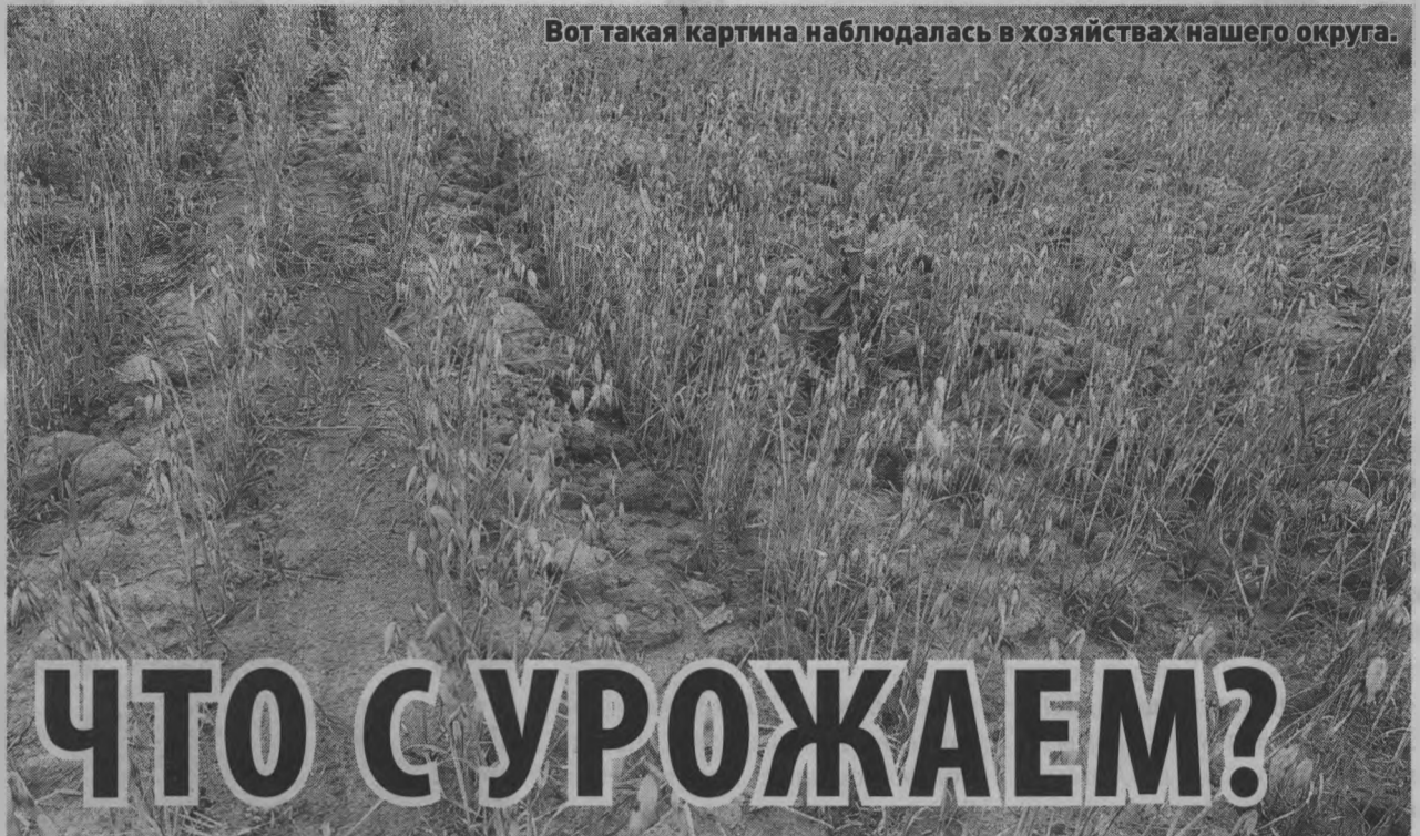
Вот такая картина наблюдалась в хозяйствах нашего округа.