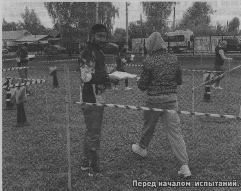
Перед началом испытаний.

Второго октября физкультурно-оздоровительный комплекс «Арена» в городе Семенов принимал в своих стенах спортсменов из 29 ФОКов Нижегородской области. Причиной такого масштабного события стала ежегодная Спартакиада трудовых коллективов физкультурно-оздоровительных комплексов Нижегородской области. Для нашего «Старта» подобная спартакиада стала уже третьей по счету, можно сказать, традиционной.