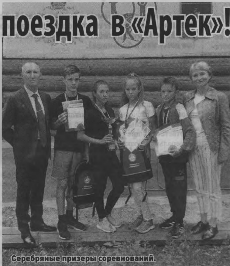
Серебряные призеры соревнований.