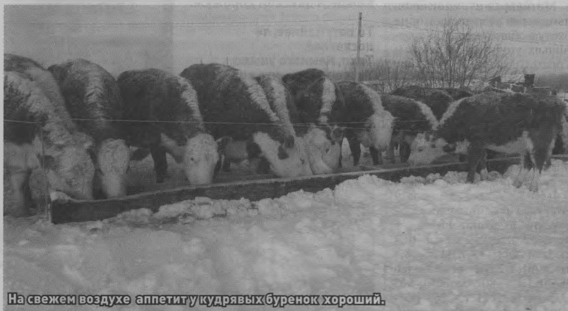
На свежем воздухе аппетит у кудрявых буренок хороший.

Зимне-стойловый период — серьезный экзамен для животноводов