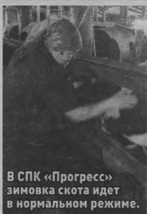
В СПК «Прогресс» зимовка скота идет в нормальном режиме.

— В сельскохозяйственных предприятиях Тоншаевского района зимовка скота проходит в штатном режиме. Январские морозы не оказали какого-либо негативного влияния на технологические процессы в животноводстве, и тем более, на состояние животных. Кормами хозяйства района обеспечены на 104 процента, то есть на одну условную голову крупного рогатого скота было заготовлено 28,4 центнеров кормовых единиц грубых и сочных кормов. Для нормального проведения зимне-стойлового периода запасов достаточно.