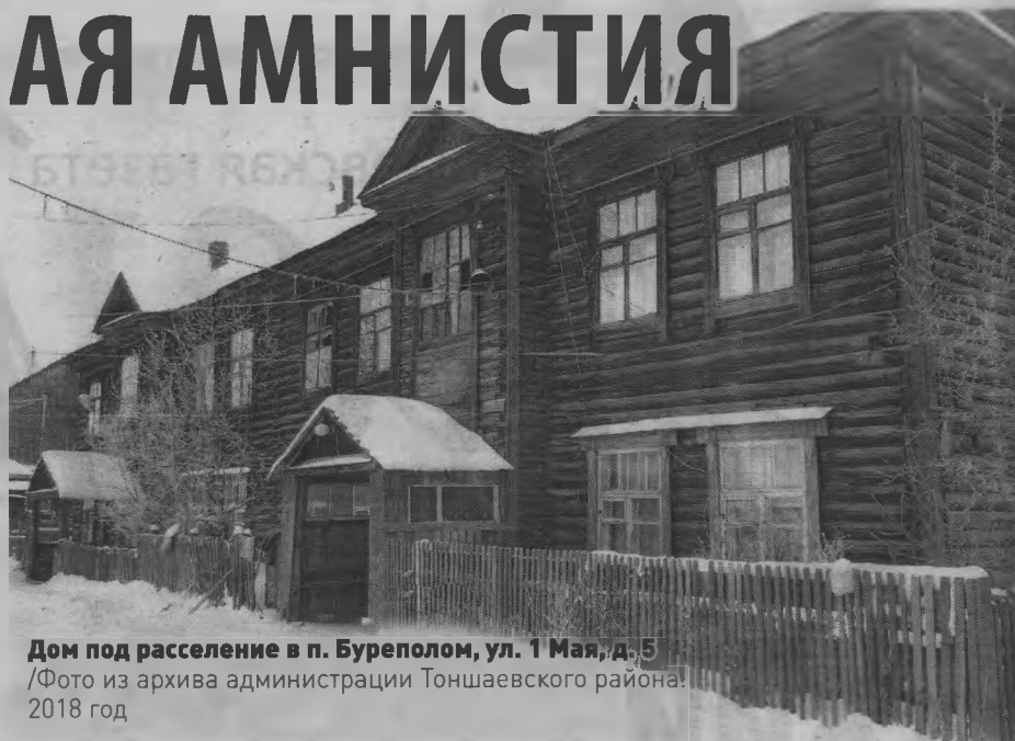
Дом под расселение в п. Буреполом, ул. 1 Мая, д. 5 /Фото из архива администрации Тоншаевского района. 2018 год

С 2019 года по сегодняшний день из аварийных квартир уже переселились 2460 нижегородцев. Новое жилье ожидают еще 11 458 человек, проживающих в ветхом фонде.