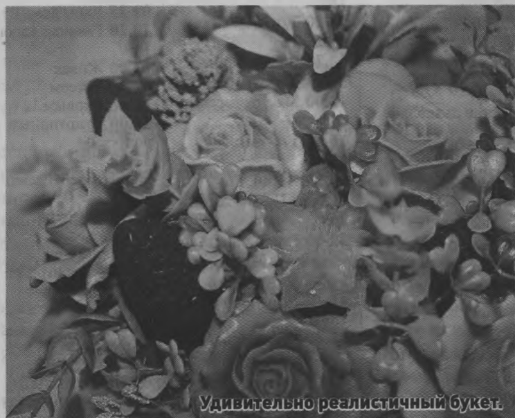
Удивительно реалистичный букет.