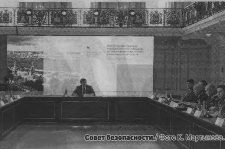
Совет безопасности.

«Текущий год выдался особенно сложным для аграриев. Обильные осадки весной осложняли ход полевых работ, а летом, напротив, сельхозпроизводители столкнулись с засухой, которая мешала при вызревании урожая. В то же время, несмотря на все сложности, наши аграрии успешно выполнили