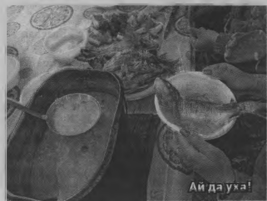
Ай да уха!