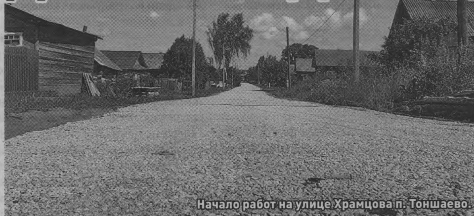
Начало работ на улице Храмцова в п. Тоншаево.

Уже много лет жителей улицы Храмцова в поселке Тоншаево волновал один очень важный вопрос – дорога. Как они сами говорили, пришла весна, растаял снег, а со снегом соответственно и асфальт сошел. Огромных размеров ямы, глубокие лужи весной, мимо которых не пройти – все это теперь позади, так как данная проблема нашла свое решение.