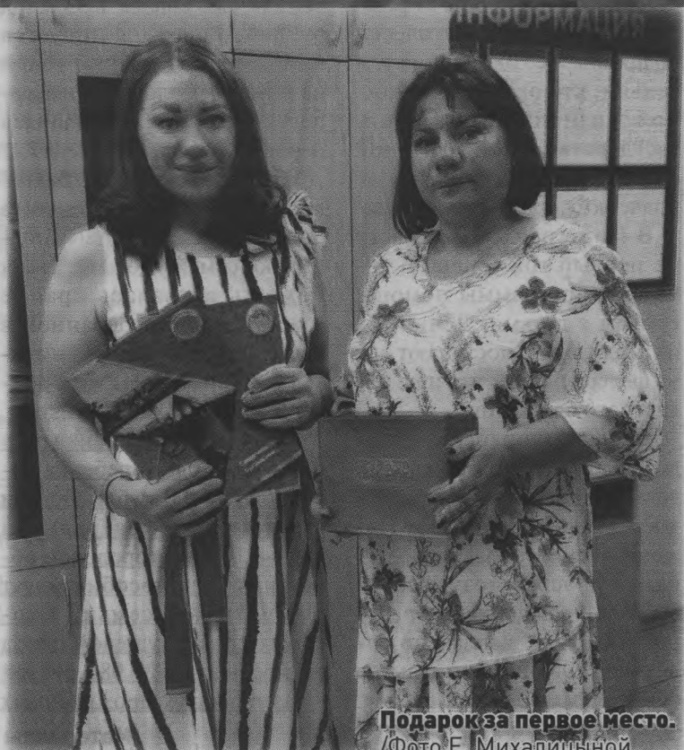
Подарок за первое место.