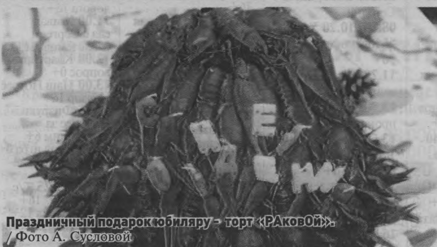
Праздничный подарок юбиляру - торт «РАКОВОЙ».