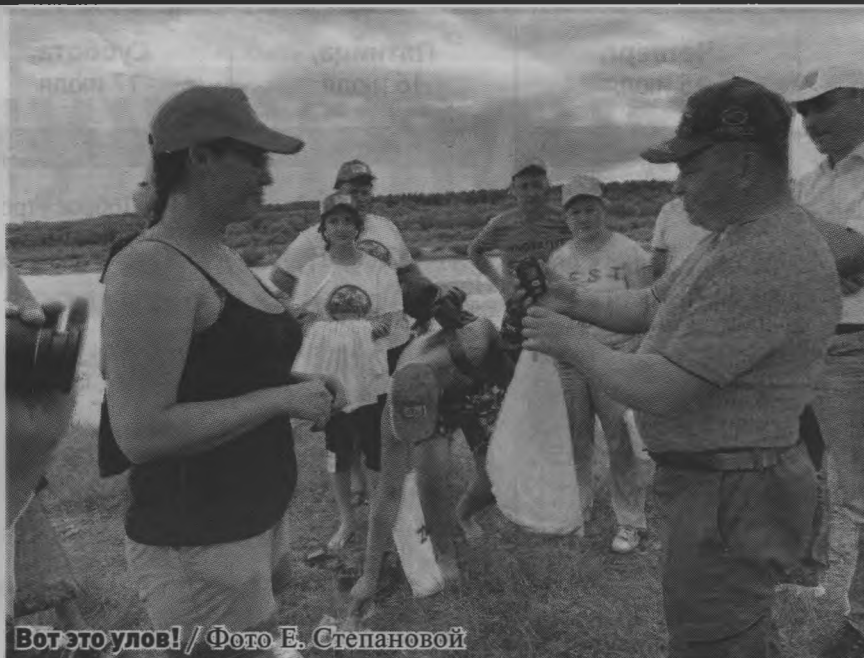
Вот это улов!