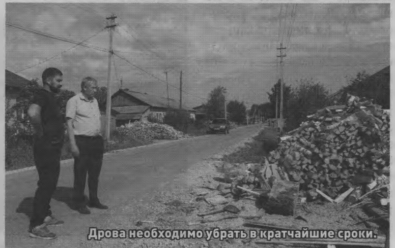
Дрова необходимо убрать в кратчайшие сроки.