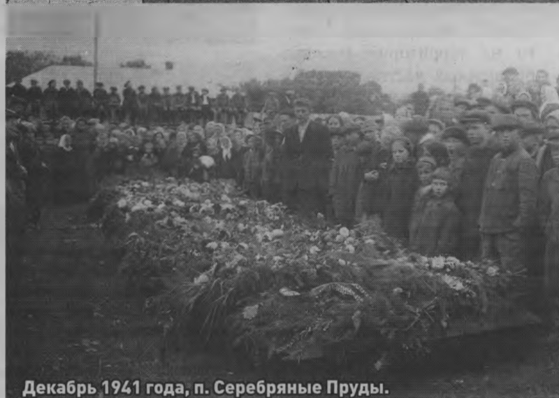
Декабрь 1941 года, п. Серебряные Пруды.

ла родственникам в Ветлугу, попросив их купить районку и выслать в Ханты-Мансийск. Так несколько номеров «Земли Ветлужской» отправились в далекий северный город. Просьба мамы была исполнена, теперь и дочка с нетерпением ждала вестей с родины.