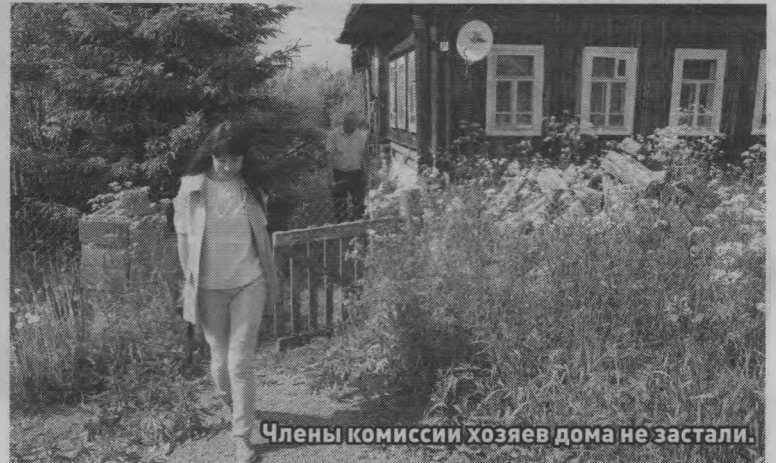
Члены комиссии хозяев дома не застали.