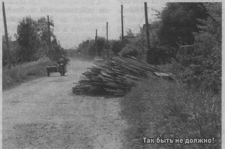
Так быть не должно!