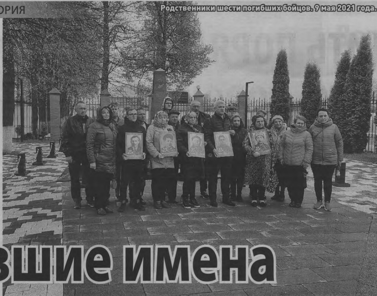
Родственники шести погибших бойцов. 9 мая 2021 года.