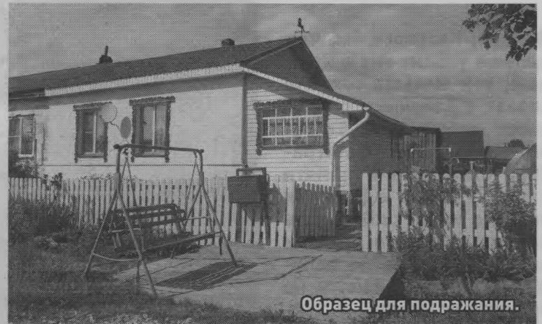
Образец для подражания.