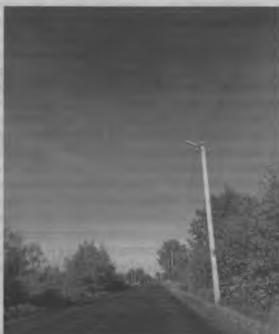
▲ Улица Кирова, п. Пижма. Работы уже закончены.