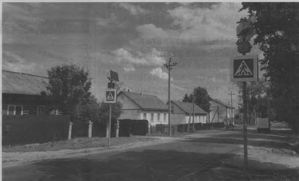
▲ Проезд к промышленной зоне в п. Тоншаево: здесь заасфальтированы улицы Чкалова и Я. Горева.