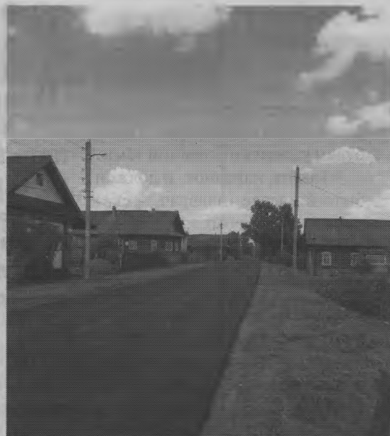
▲ Улица Центральная, п. Тоншаево.