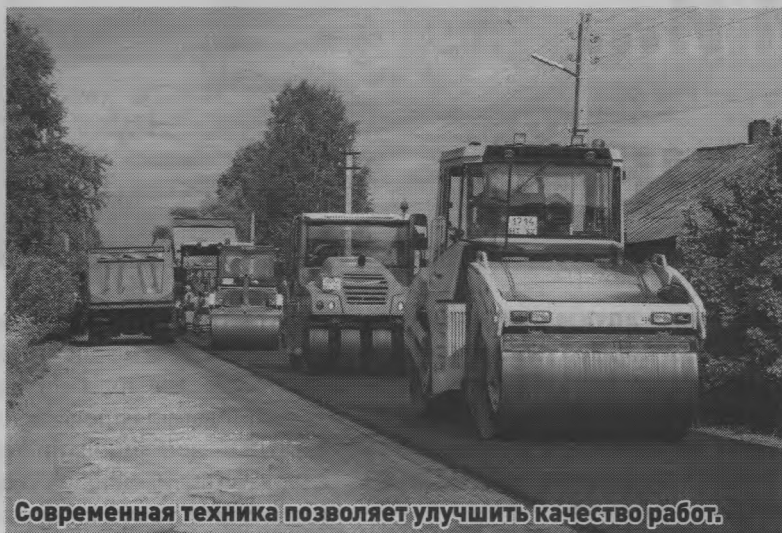
Современная техника позволяет улучшить качество работ.

И вот свершилось! К ремонту дороги приступила подрядная организация ООО ДСК «Гранит». Работы ведутся за счет средств областного дорожного фонда и кипят вовсю: новенькие грузовики то и дело подвозят горячую массу, выгружают в асфальтоукладчик, а три катка тут же следом утюжат новое дорожное полотно. Протяженность отремонтированного пути составит два километра пятьсот метров, ширина дороги – шесть метров. За процессом с большим интересом наблюдают и жители,