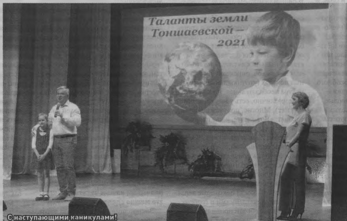
С наступающими каникулами!