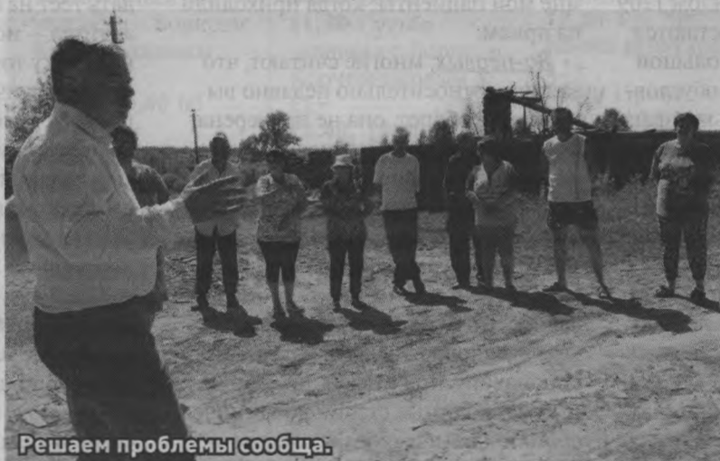
Решаем проблемы сообща.