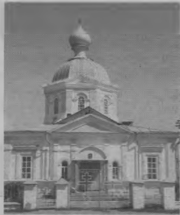
Кронштадскому. Заупокойная лития.

Четверг, 3 июня «Владимирская икона Божией Матери» 7.30 Молебен. Заупокойная лития. Суббота, 5 июня 7.30 Молебен св. мцц. Евдокии, Дарии, Дарии и Марии Суворовским (Нижегородские). Панихида. 16.00 Вечернее богослужение. Исповедь. Воскресенье, 6 июня «Неделя о слепом» 7.30 Литургия. Понедельник, 7 июня 7.30 Молебен Пророку и Предтечи Господню Иоанну. Заупокойная лития. Среда, 9 июня 16.00 Вечернее богослужение. Исповедь. Четверг, 10 июня 7.30 Водосвятие. Литургия. Пятница, 11 июня 7.30 Молебен Свт. Луке Крымскому. Заупокойная лития. Суббота, 12 июня 7.30 Служба в п. Шайгино 16.00 Вечернее богослужение. Исповедь. Воскресенье, 13 июня «Неделя святых отцов 1-го Вселенского собора» 7.30 Литургия. Понедельник, 14 июня 7.30 Молебен св. прав. Иоанну