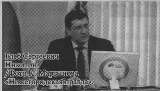
Глеб Сергеевич Никитин.