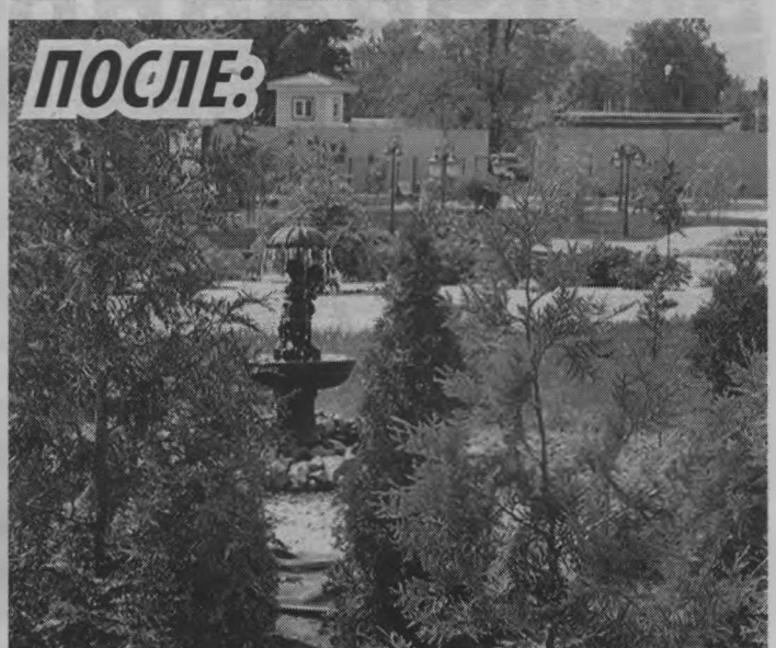
▲ Реализованные проекты. г. Выкса, дендрарий на территории парка культуры и отдыха.

Горячая линия по вопросам рейтингового голосования за объекты благоустройства в 2022 году на платформе golosza.ru будет работать с 19 апреля по 30 мая, в круглосуточном режиме. Единый бесплатный номер: 8 (800) 600-20-13 будет доступен для каждого гражданина из любого уголка России.