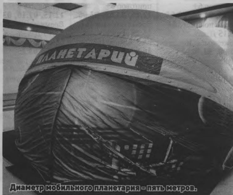
Диаметр мобильного планетария - пять метров.

Посмотреть на вращающееся звездное небо, послушать интересный рассказ о космосе и даже примерить настоящий гермошлем посчастливилось тоншаевским школьникам на этой неделе. Чем вам не путешествие в космос?