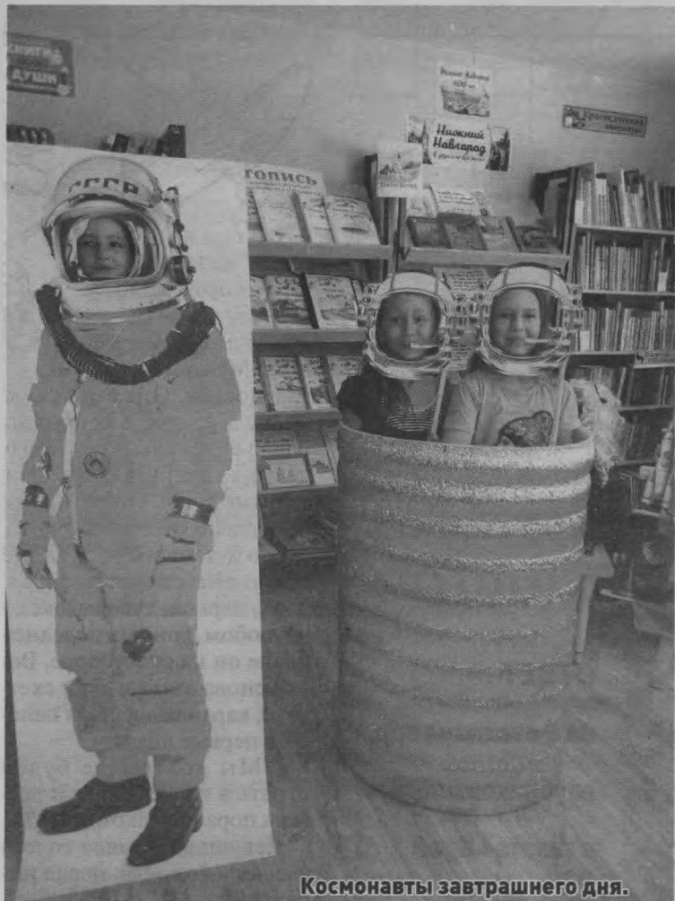
Космонавты завтрашнего дня.

теки провели мероприятия в общеобразовательных, дошкольных учреждениях муниципального округа.