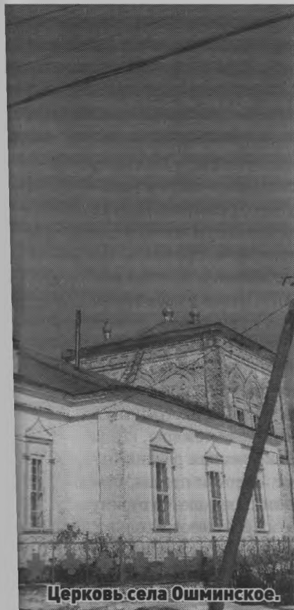
Церковь села Ошминское.

Татьяна ПОСАЖЕННИКОВА.