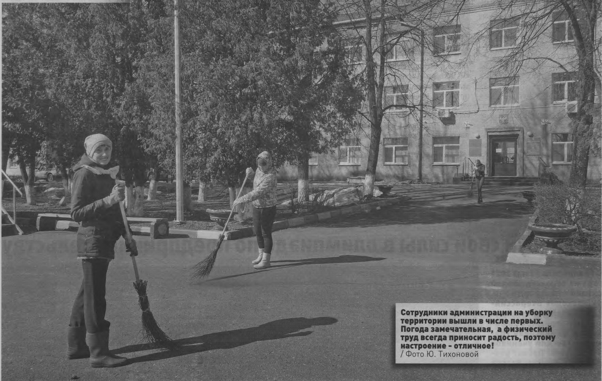
Сотрудники администрации на уборку территории вышли в числе первых. Погода замечательная, а физический труд всегда приносит радость, поэтому настроение - отличное!