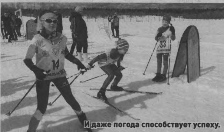
И даже погода способствует успеху.