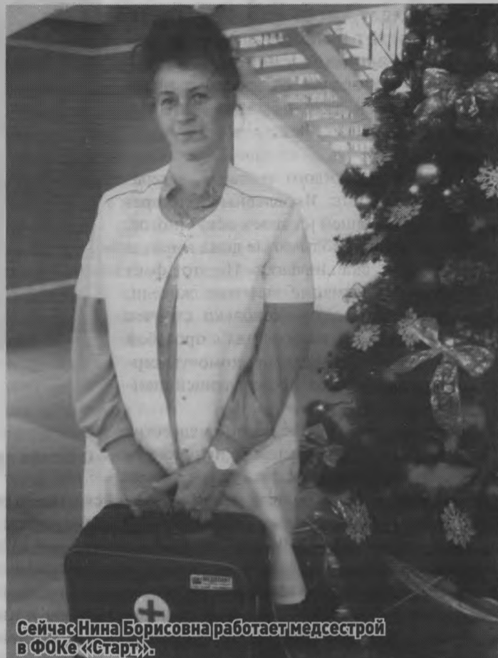
Сейчас Нина Борисовна работает медсестрой в ФОКе «Старт».

Екатерина ЗАЙЦЕВА.