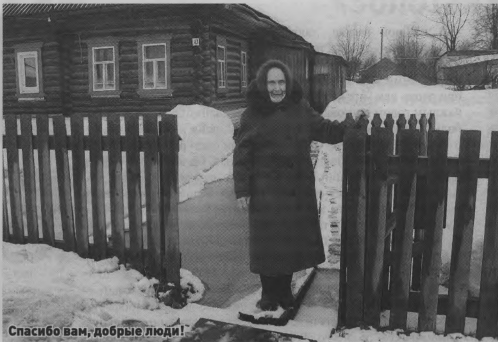
Спасибо вам, добрые люди!

- Я слышу какие-то разговоры у дома, - с искренней радостью продолжает рас-