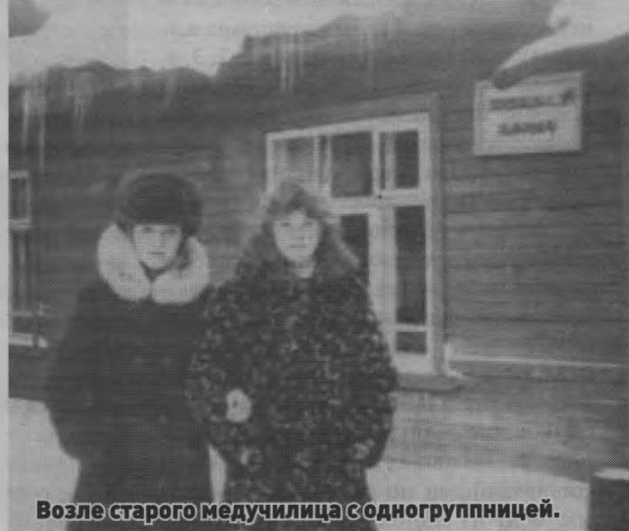
Возле старого медучилища с одногруппницей.