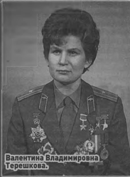
Валентина Владимировна Терешкова.