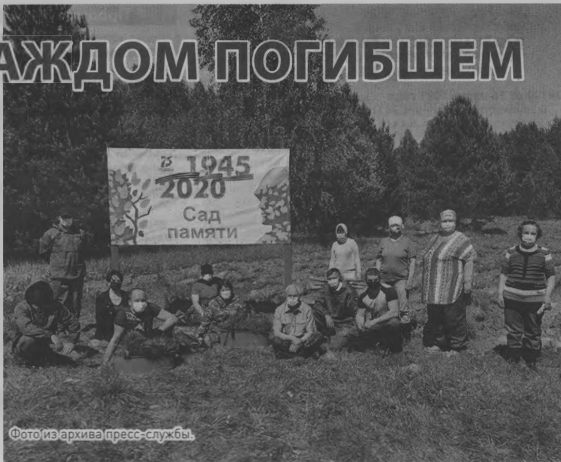
Фото из архива пресс-службы.

Пресс-служба губернатора и правительства Нижегородской области