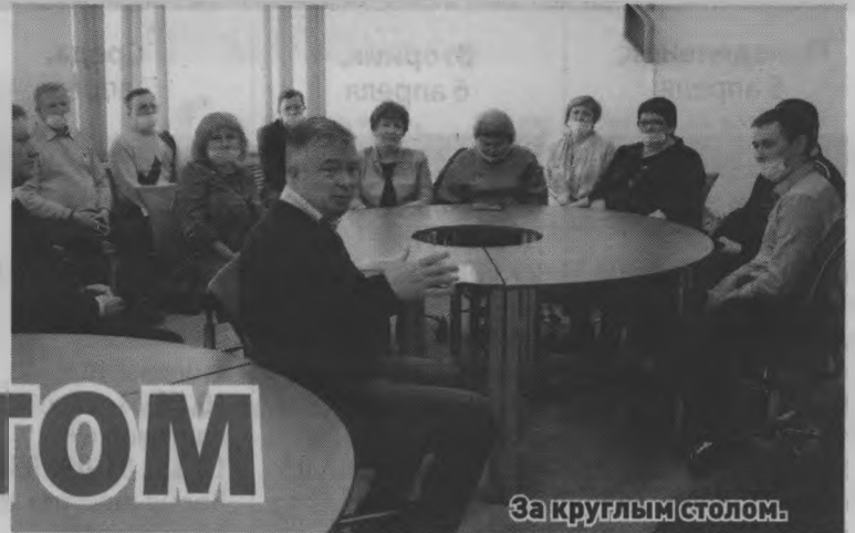
За круглым столом.

От имени семей-участниц и от имени организаторов конкурса выражаем благодарность за спонсорскую помощь управлению образования Тоншаевского округа и Тоншаевскому райпо.