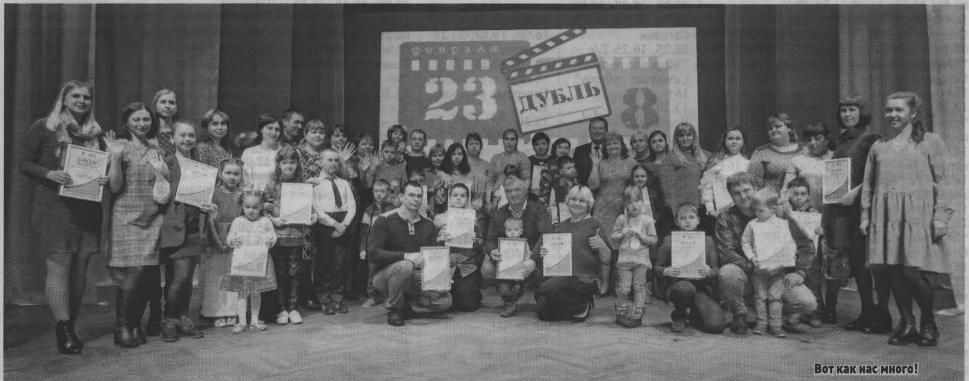
Вот как нас много!