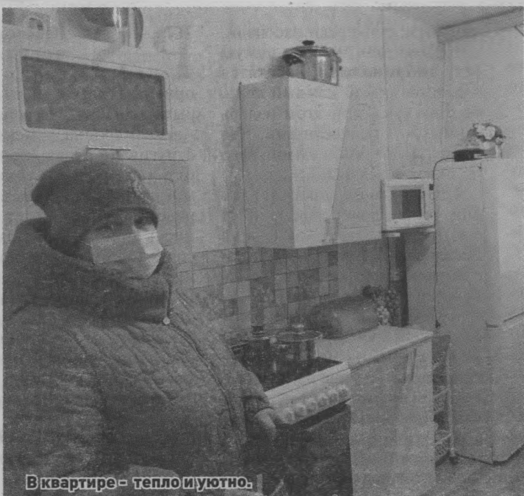
В квартире - тепло и уютно.

Что касается двух многоквартирных домов, которые появились в нашем поселке, то мы планируем с приходом весны благоустроить территорию вблизи них, чтобы жильцам было удобно