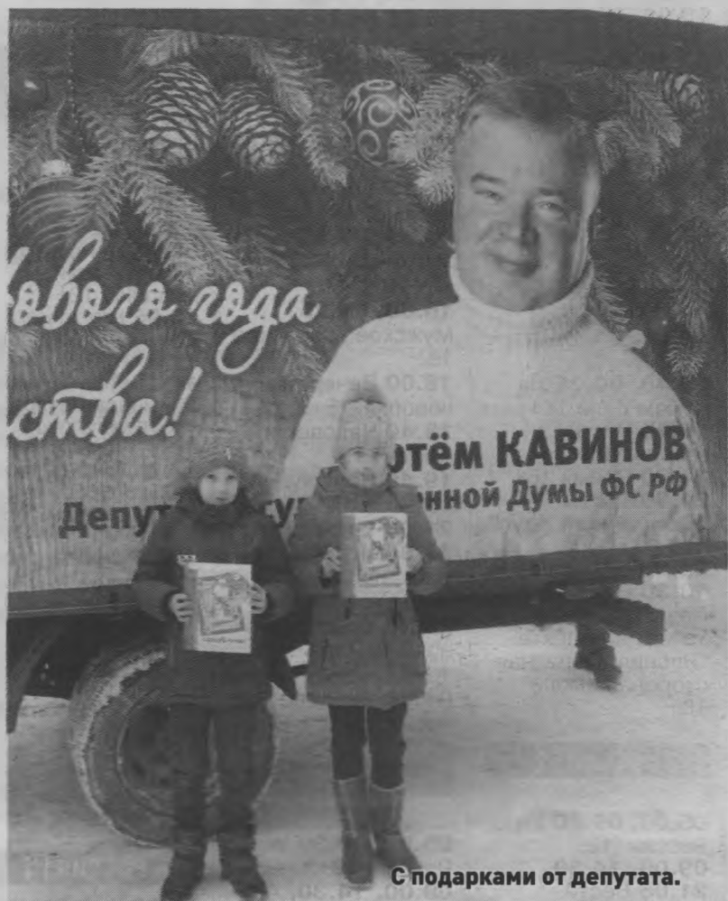
С подарками от депутата.