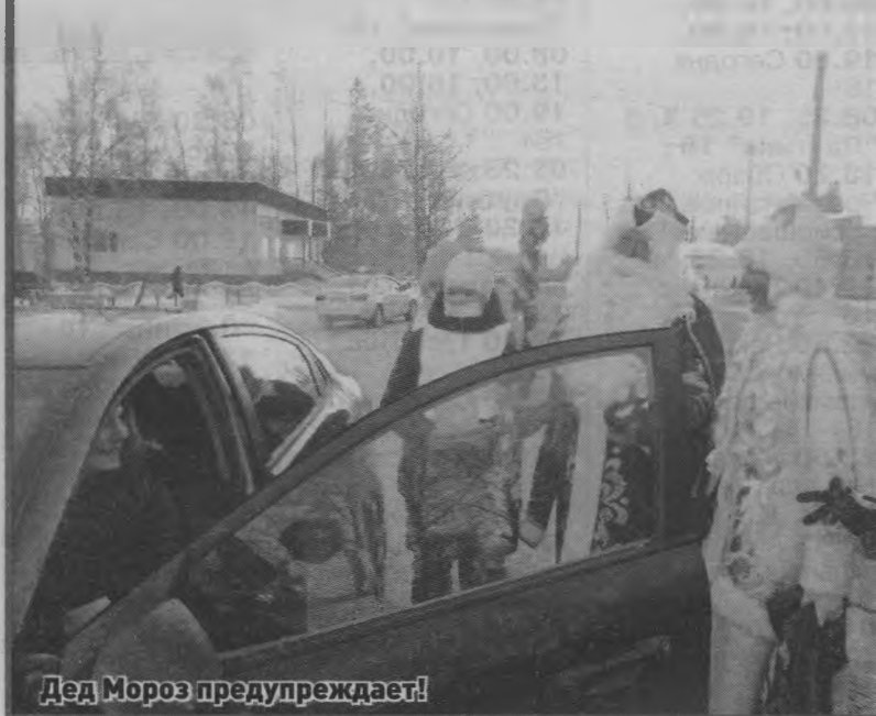
Дед Мороз предупреждает!