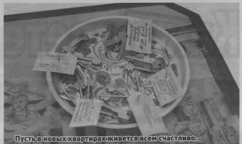
Пусть в новых квартирах живетесь всем счастливо.

- Мы очень довольны, - продолжает рассказывать хозяйка, - вот, обживаемся, ждем новую мебель, ее скоро должны привезти. Вот тут будет стенка, тут телевизор. До этого мы жили в старом деревянном доме, как здесь принято называть, в бараке, постройки 1939 года. Старались поддерживать его в нормальном состоянии, да только одними стараниями невозможно было справиться - крыша прохудилась. А здесь все новое: полный косметический ремонт, новая сантехника, уже подключены все коммуникации, в том числе центральное отопление, электричество, горячая и холодная вода. Остается радоваться, да и только!