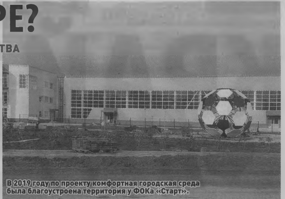
В 2019 году по проекту комфортная городская среда была благоустроена территория у ФОКа «Старт».

То есть нижегородцы смогут проголосовать за объекты, которые благоустроят в 2022 году, и на сайте golosza.ru , и на федеральной платформе