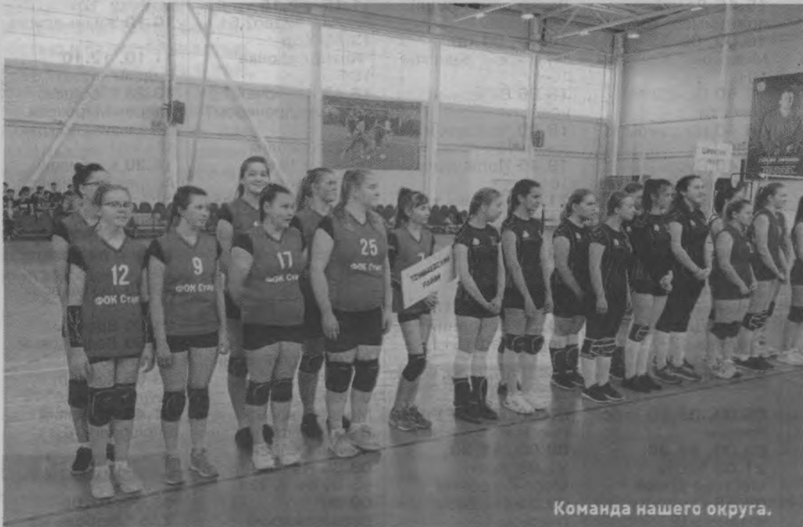
Команда нашего округа.

Минувшие выходные для спортсменов ФОКа «Старт» выдалась насыщенными и яркими на события. Играли как на выезде, так и в нашем спортивном комплексе. Впервые после долгого перерыва на соревнованиях разрешили присутствовать зрителям.