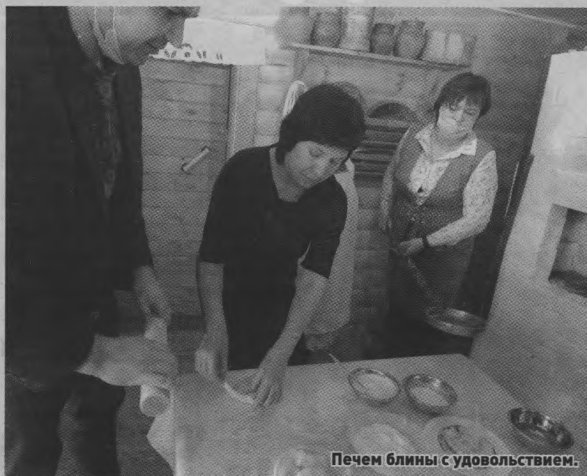
Печем блины с удовольствием.

А еще впечатлил физкультурно-оздоровительный комплекс «Жем-