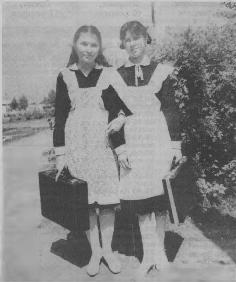
▼ А мы ничуть не изменились...