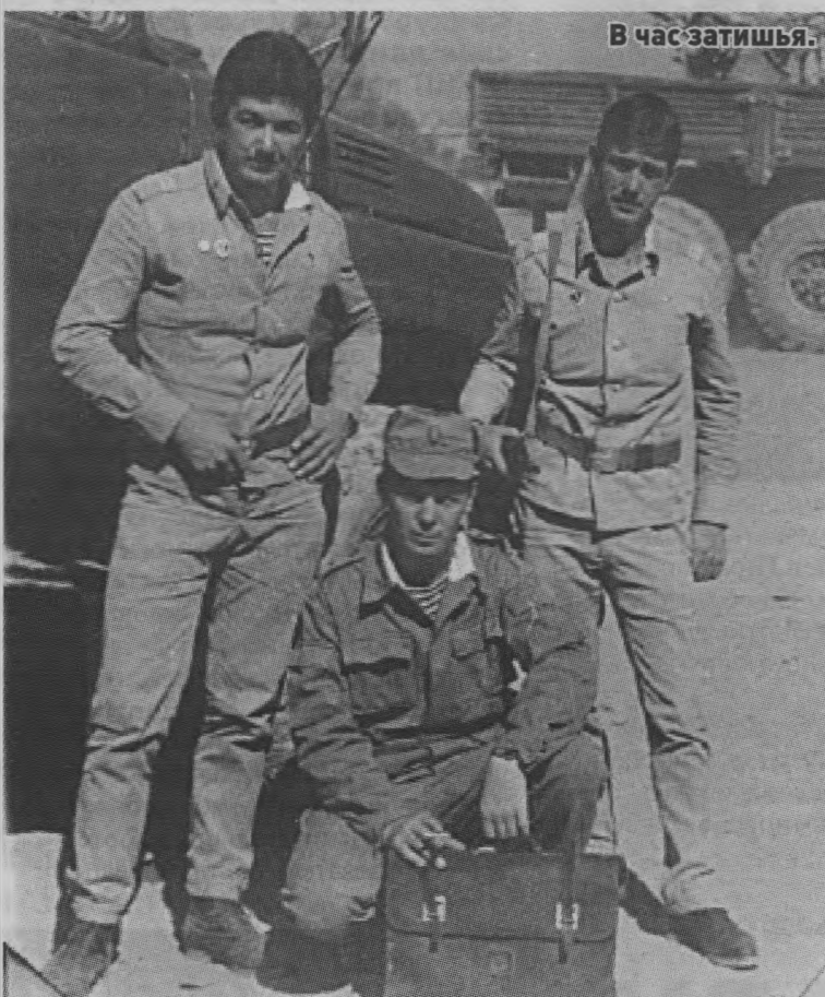
В час затишья.

солдаты-срочники проживали как последний. На каждом шагу чувствовалось присутствие смерти. Война, что с нее взять!