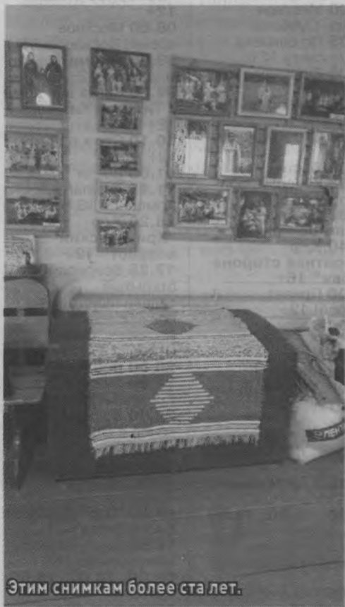
Этим снимком более ста лет.