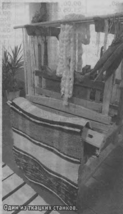
Один из ткацких станков.