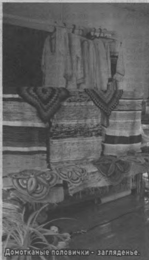
Домотканые половички - загляденье.