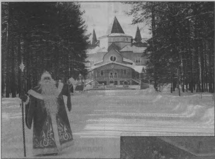
Дед Мороз всегда рад гостям в своем доме в Великом Устюге.

Персонаж загадочный, сказочный, всеми любимый и ожидаемый. Кто же это? Конечно, Дед Мороз. Наверное, многие ребята уже задумываются, какой же им подарок к Новому году заказать у главного волшебника страны. А знаете ли вы, что и Деда Мороза можно поздравить? Причем, не дожидаясь 31 декабря, а прямо завтра. С чем же? Да день рождения у него 18 ноября — вот что!