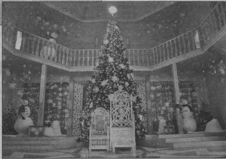
Тронный зал дома Деда Мороза.

Каков возраст зимнего волшебника — доподлинно неизвестно, но точно, что более 2000 лет, и в разные времена он был известен в нескольких образах: сначала в облике восточнославянского духа холода Трескуна, затем как персонаж сказок Морозко или Мороз Иванович.