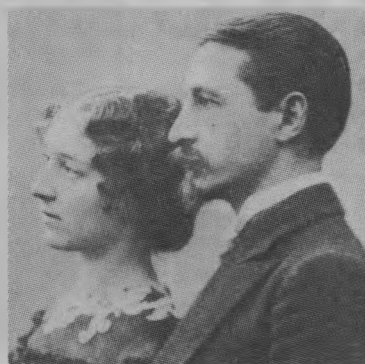
▲ Иван Бунин и Вера Муромцева.

Все, что осталось в СССР, представлялось писателю чуждым и враждебным. За границей он начал вести общественно-политическую деятельность и вскоре превратился в одну из главных фигур эмигрантской оппозиции. В 1920 году Бунин стал членом парижского Союза русских писателей и журналистов,