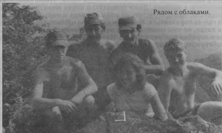
Рядом с облаками.