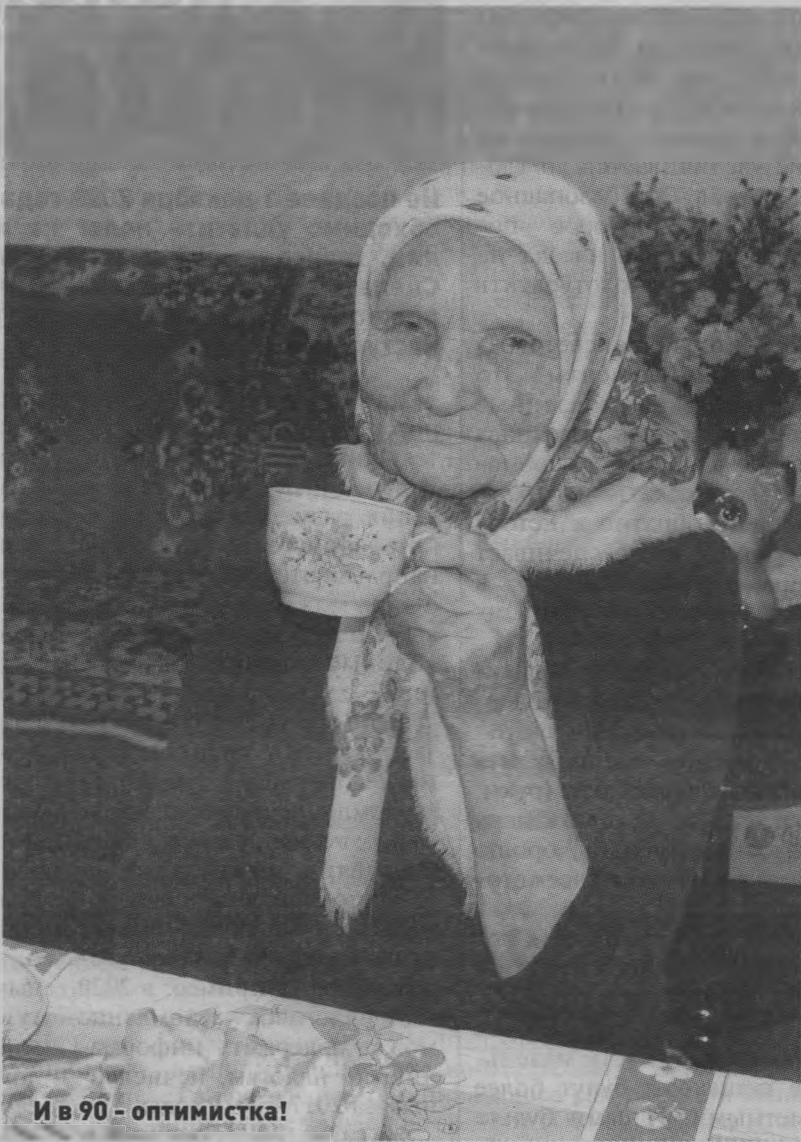
И в 90 - оптимистка!