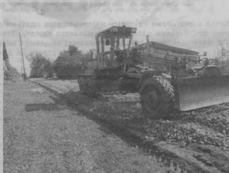
◆ Процесс работ.