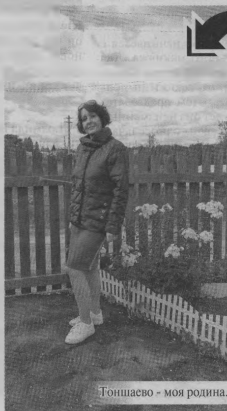
Тоншаево - моя родина.

За окном пробегает дорога, На душе так тепло и светло. Мне для счастья надо немного - Лишь уехать сейчас далеко. Да, я буду скучать, но не долго, Не судите строго меня. Я, как та новогодняя ёлка, Что живет в ожидании дня, Когда праздник наступит снова, Когда ярко зажгут огни, Когда год постучит к нам новый, И счастливыми будут дни. Да, я буду скучать, и может, Побежит по щеке слеза. Но тоска моё сердце не гложет, Улыбаются даже глаза. Вы простите, если обидела, Уезжаю я с лёгкой душой. За окном новый мир я увидела, Но, а здесь навсегда дом родной. Я вернусь, но не скоро. Я знаю. Поклонюсь я родной стороне... Ты прости, что опять уезжаю, Это нужно сейчас очень мне.