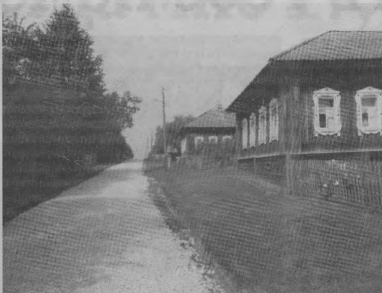
◆ Благоустройство улицы в д. Кодочиگی.