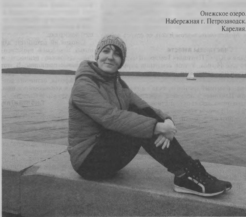
Онежское озеро. Набережная г. Петрозаводск. Карелия.