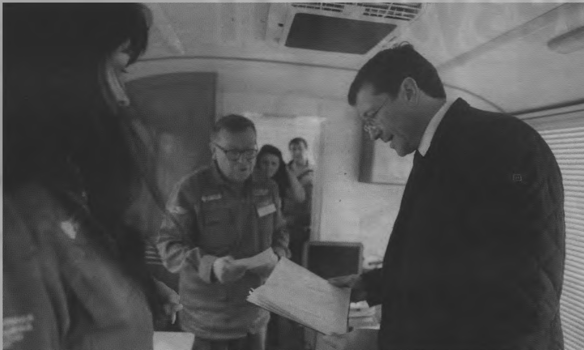
В этом году Поезда здоровья дооснастили модулями диагностики. Это еще больше повышает возможности поездов - сказал губернатор.

Напомню, что в Послании Федеральному Собранию Президент России Владимир Путин сделал акцент именно на развитии первичного звена. Это тот уровень, на котором должны чаще всего звучать «тревожные звонки», и с которого люди должны направлять уже в межрайонные и областные центры, - резюмировал Глеб Никитин.