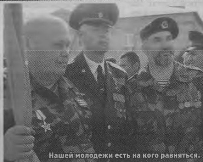
Нашей молодежи есть на кого равняться.