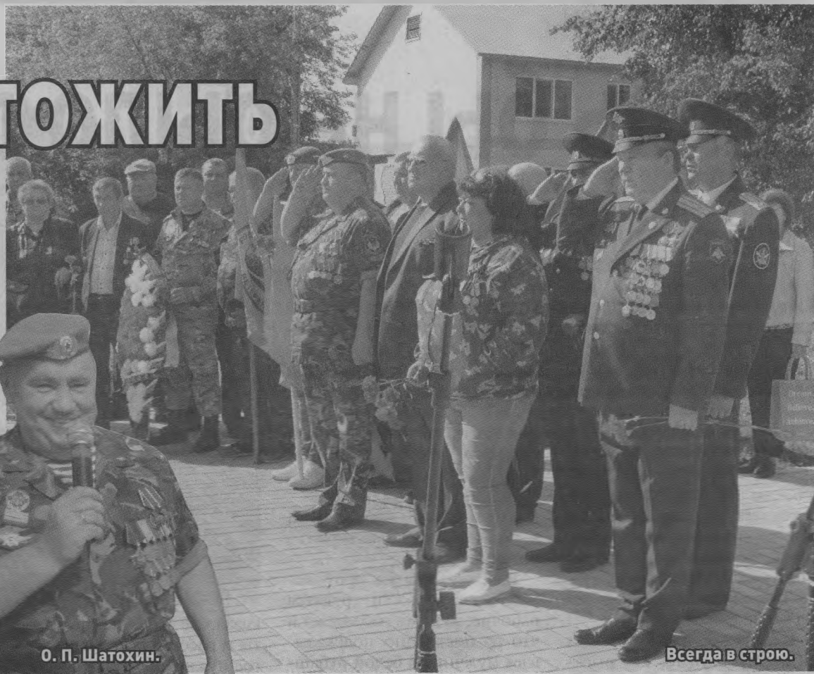
Всегда в строю.