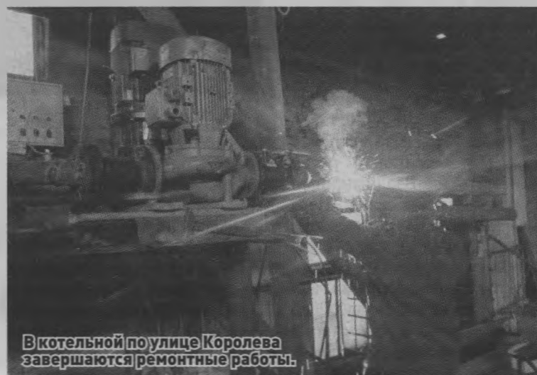
В котельной по улице Королева завершаются ремонтные работы.