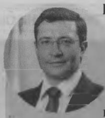
Глеб НИКИТИН, губернатор Нижегородской области:

«Это необходимо на случай, если какой-то рециркулятор вдруг выйдет