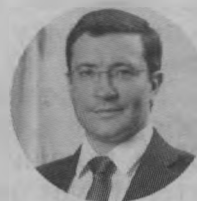
Глеб НИКИТИН, губернатор Нижегородской области:

– Задача медучреждений – грамотно организовать маршрутизацию пациентов, чтобы избежать скопления людей.