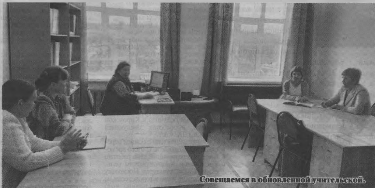
Совещаемся в обновленной учительской.

Надеемся, что эти обновления будут приносить радость преподавательскому составу школы, улучшая их настроение, что непременно будет отражаться в классных журналах положительными отметками учащихся.