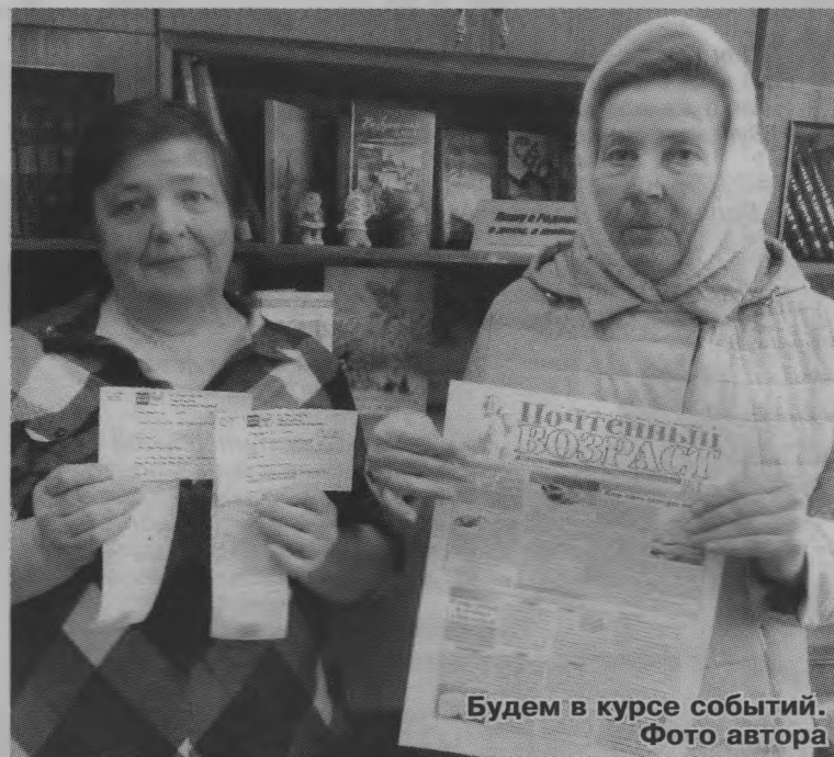
Будем в курсе событий.