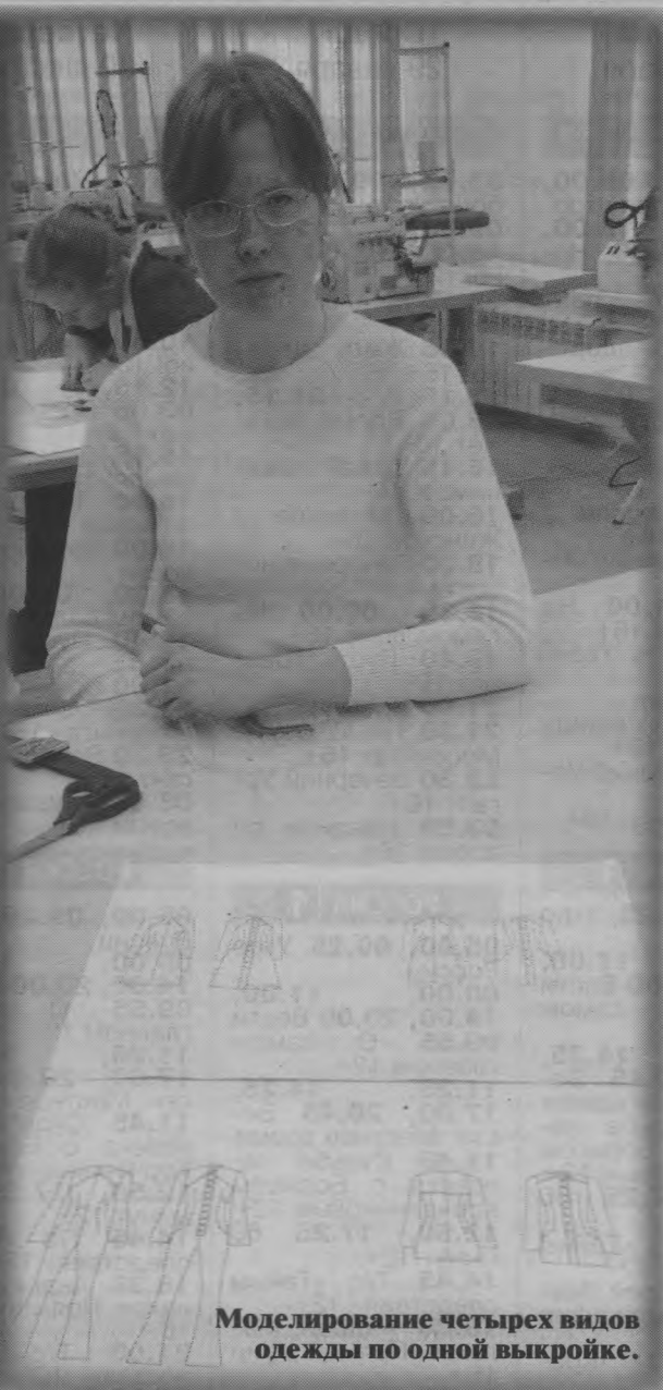
Моделирование четырех видов одежды по одной выкройке.

Домой навещаю раз в месяц, на первом и втором курсе ездила чаще. Сейчас же записалась в автошколу и теперь передо мной встала еще одна задача – получить водительские права, ну и продолжать саморазвиваться.