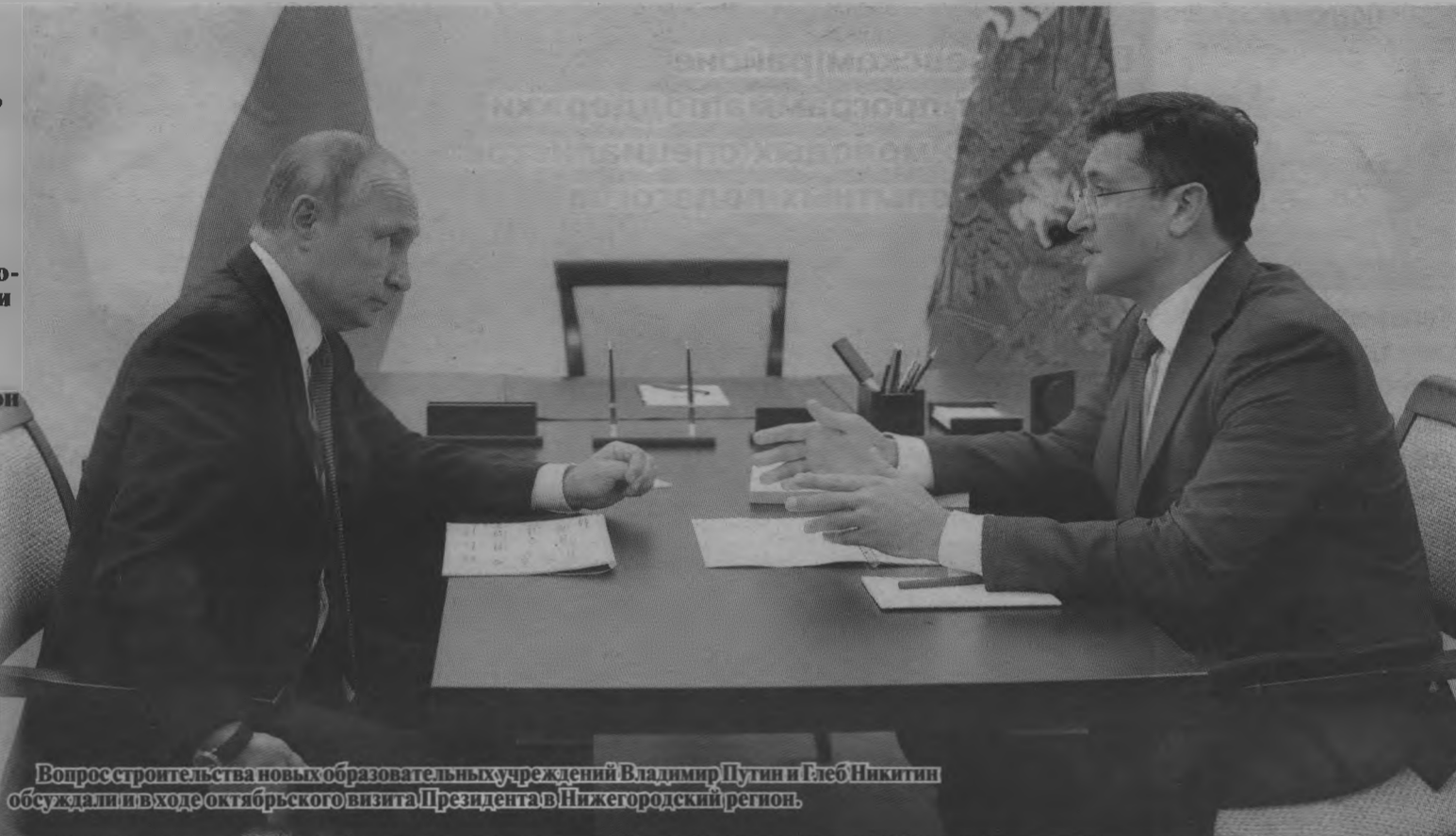
Вопрос строительства новых образовательных учреждений Владимир Путин и Глеб Никитин обсуждали в ходе октябряского визита Президента в Нижегородский регион.

Более чем серьезные меры поддержки будут оказаны и нуждающимся нижегородцам в рамках социальной помощи. В прошлом послании