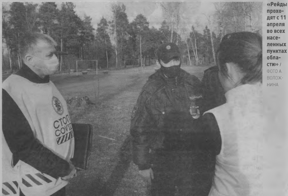
«Рейды проходят с 11 апреля во всех населенных пунктах области»

Согласно изменениям в Указе, граждане приезжающие в наш регион любыми видами транспорта, в течение одного часа с момента пересечения границы Нижегородской области должны сообщить о своем прибытии. Они обязаны предоставить контактную информацию (Ф.И.О., место отправления, место фактического пребывания на территории Нижегородской области, номер телефона, номер автомобиля) с использованием сервиса «Карта жителя Нижегородской области» (портал nn-