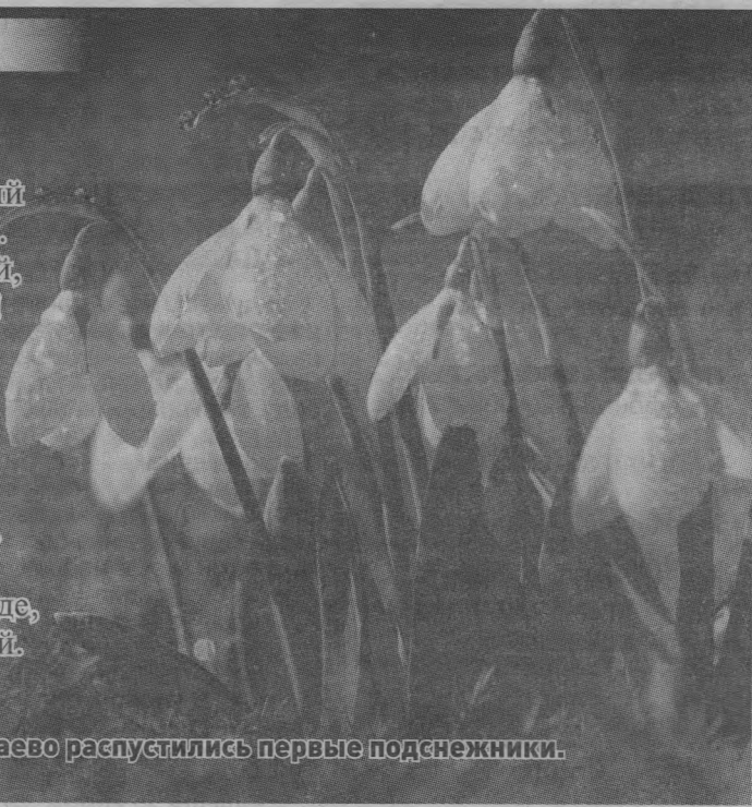
На улице Сельской поселка Тоншаево распустились первые подснежники.

Цветок апрельский белый-белый Пробился робко сквозь сугроб. Он нежный, тонкий и не смелый, Но гордый, словно небоскреб! Его теплом своим согрею, Шепну ему: «Малыш, живи!» Вселяй в сердца людей скорее Добра побольше и любви. Вселяй весну, вселяй надежду, Своим приходом землю грей. Ты — пробуждение, ты, как прежде, Приносишь радость в мир людей.