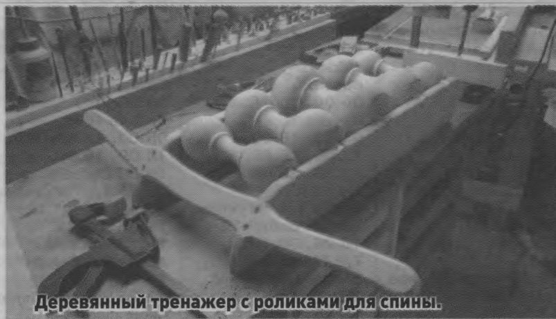
Деревянный тренажер с роликами для спины.

как заработать хотя бы на самое необходимое. В те далекие годы я решил принять участие в выставке, которую организовал наш районный краеведческий музей. Специально для выставки я смастерил из бересты самовар, поднос и шесть рюмочек, и через какое-то время мою работу купили. Честно скажу, и я, и вся моя семья были очень рады этому. С тех дней прошло много времени. Но и сейчас, бывает, смастерю за зиму штук десять шезлонгов и выставлю на продажу. Скажем так, деньги небольшие, но на жизнь хватает. Заказы тоже бывают, но редко. Один раз, например, коллега по работе заказал деревянный тренажер с роликами для спины. Сделал ему, он моей работой похвастался, тут и другим захотелось. Или еще случай: понадобился для маленького внука детский