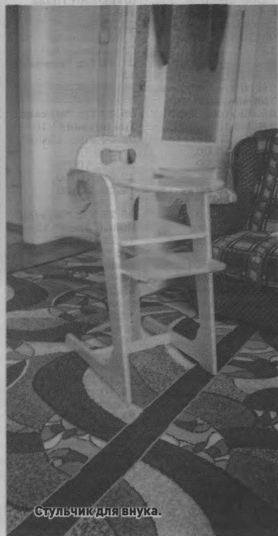
Стульчик для внука.

Валентина РОМАНОВА.