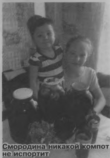
Смородина никакой компот не испортит

Я думаю, всем понятно, что речь идет о всем известной садовой ягоде – смородине. Она есть, пожалуй, в каждом саду, хотя современные южные культуры, такие как ежевика или земляника, все сильнее притесняют ее, отодвигая на второй план. А жаль, ведь смородина – самая богатая витаминами ягода: черная – витамином С, красная – витамином А, белая – витамином Е.