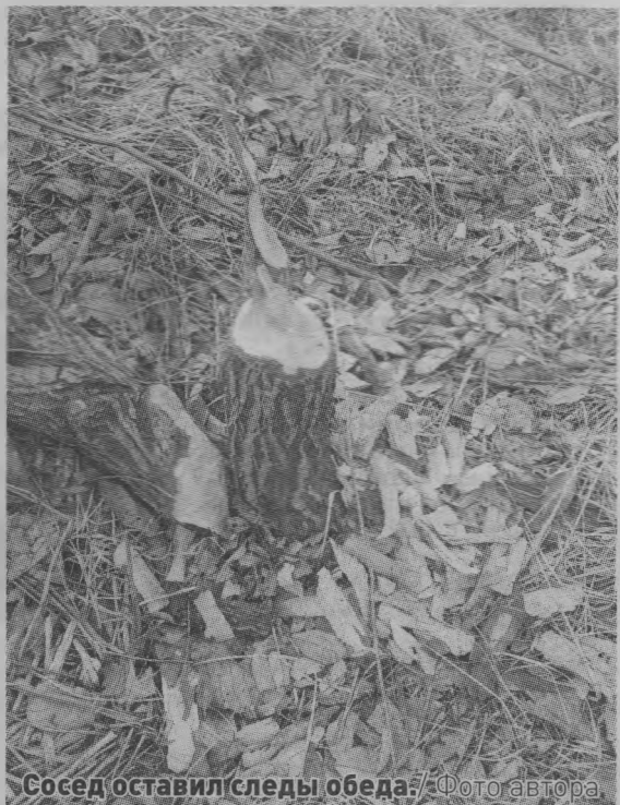
Сосед оставил следы обеда.

Вы сейчас о ком подумали? О людях? Нет же, это я о зверьках, поселившихся у нас на пруду.