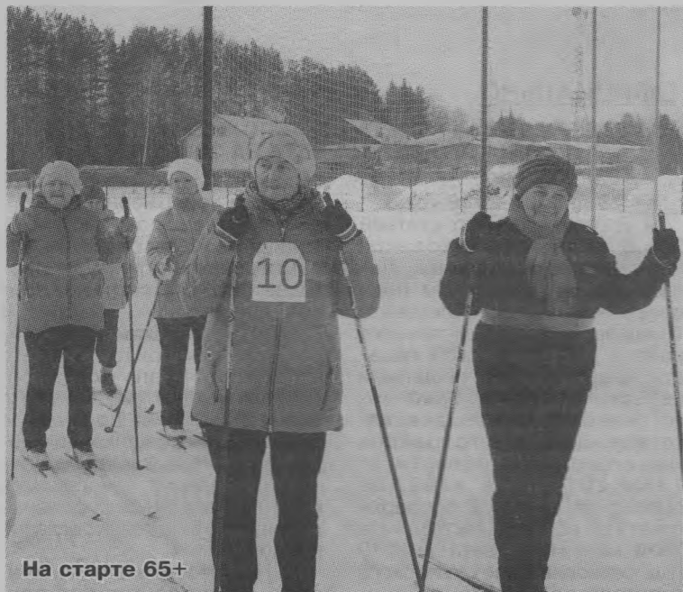
На старте 65+

Для многих 5 февраля – это обычный день недели, а для участников первых соревнований по лыжным гонкам «Все на старт – 2020» в возрастной группе 55 лет и старше – это особенный день. Тоншаевский ФОК «Старт» собрал на стадионе особенных жителей района – задорных, активных, неунывающих. Сегодня некоторые из них впервые за двадцать пять лет встали на лыжи, чтобы вспомнить, как это бывает, когда легкий морозец пощипывает щеки и нос, свежий воздух наполняет легкие, а под ногами бежит лыжня.