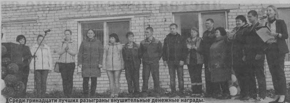
Среди тринадцати лучших разыграны внушительные денежные награды.