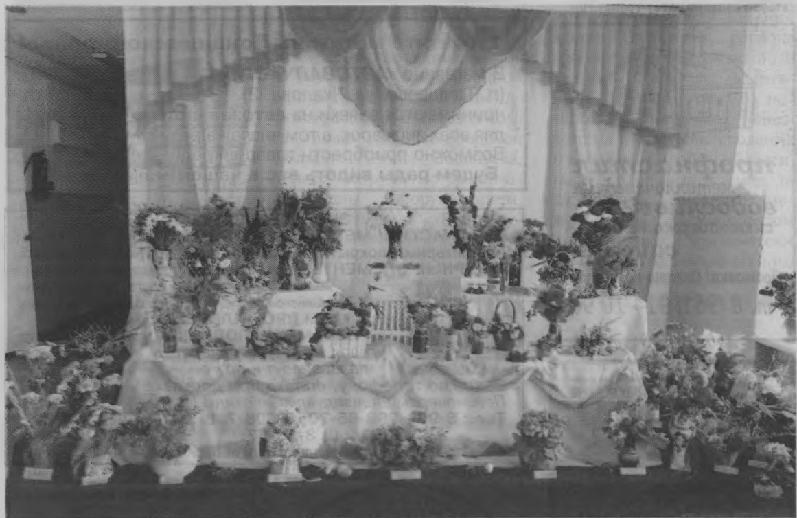
Вот и сентябрь. Ребята, конечно же, соскучились по школе, друзьям и учителям. Все с радостью окунулись в мир знаний. Но школьная жизнь - это не только учеба, но и яркие запоминающиеся праздники.