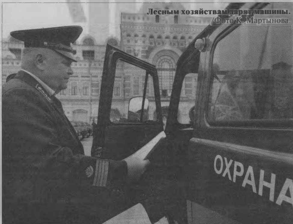
Лесным хозяйствам дарят машины.

Суммы, выделяемые из регионального бюджета на содержание лесопожарных подразделений, тоже увели-