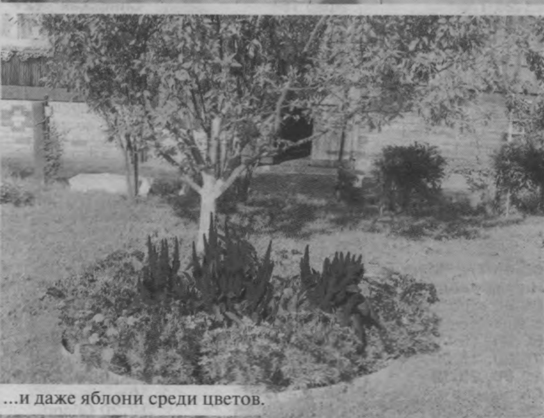
...и даже яблони среди цветов.