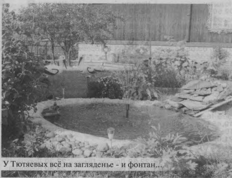
У Тютяевых всё на загляденье - и фонтан...

Материалы полосы подготовила Валентина ШИШКИНА.