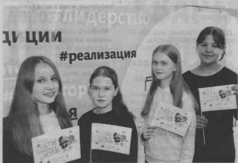
Участникам благотворительной акции «Дети вместо цветов» этот учебный год точно принесёт счастье, здоровье, радость и удачу.

Начинать новый учебный год с доброго дела - хорошая примета!