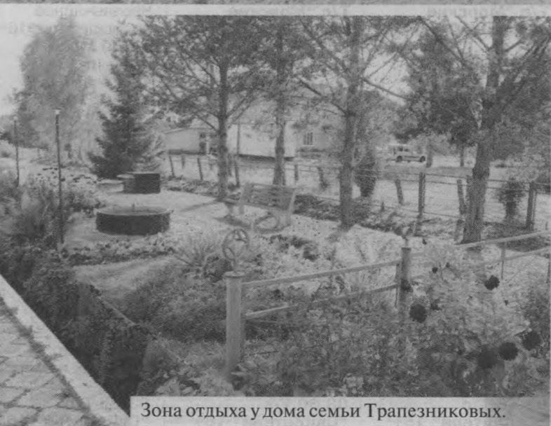
Зона отдыха у дома семьи Трапезниковых.