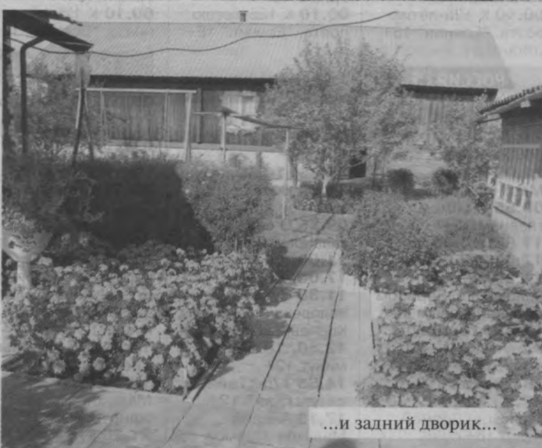
...и задний дворик...