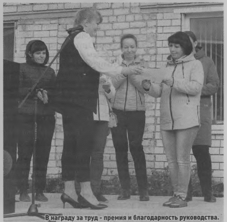
В награду за труд - премия и благодарность руководства.