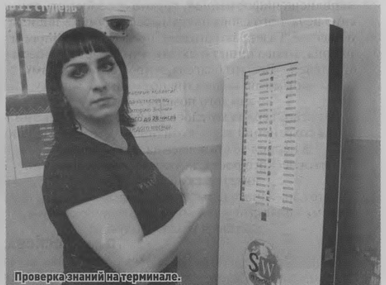
Проверка знаний на терминале.