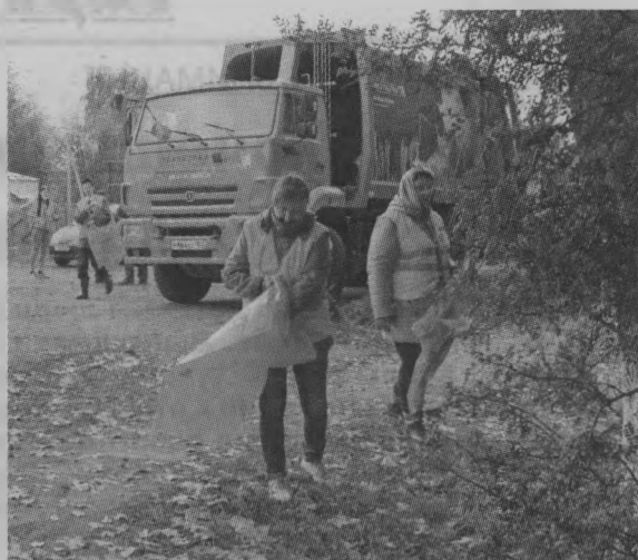
Наводите порядок - берите с нас пример!

- Нам уже привычны такие мероприятия, вот недавно очищали от мусора берег Кочешковского озера в Уренском районе. Дело нужное. Здесь же наши дети, внуки живут, и очень важно воспитывать их своим примером, с детства прививать правиль-