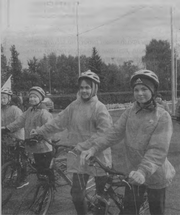
Участники велозаезда, учащиеся Тоншаевской средней школы, к велопробегу готовы.

Министерство спорта Нижегородской области