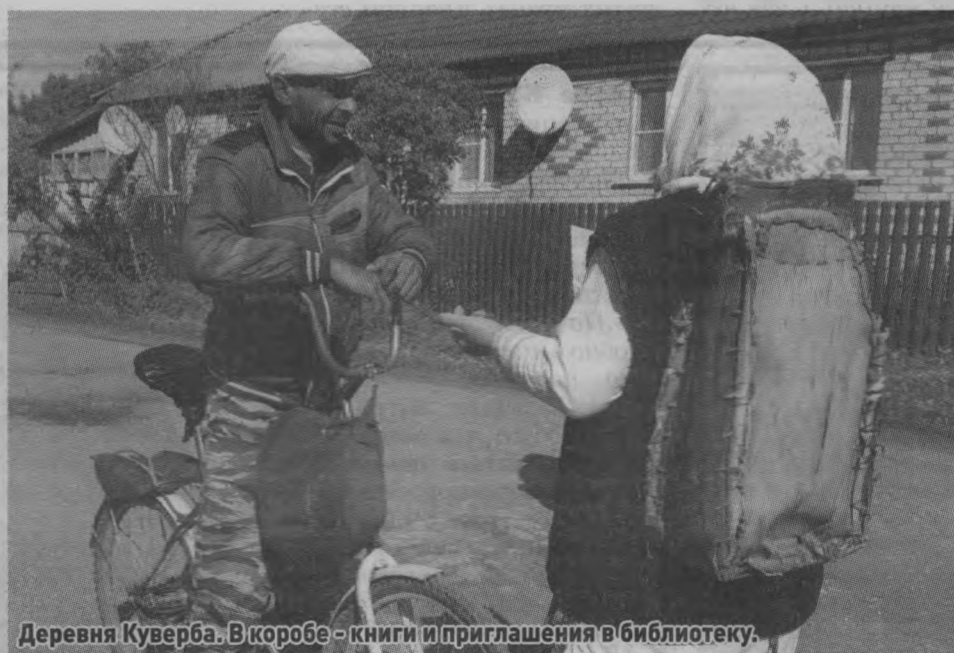
Деревня Куверба. В корзине - книги и приглашения в библиотеку.

В течение двух месяцев, июля и августа, в библиотеках района проходил первый этап подготовительной акции «Читающий поселок, село, деревня». На виртуальных площадках в социальных сетях, в группе ВК, на сайте библиотеки размещалась информация, проводились онлайн мероприятия: «Несущие мысли» (цитаты из любимых книг), «10 современных книг российских писателей о чувствах и семейных ценностях» - виртуальная книжная выставка - обзор, «20 увлекательных книг про лето», отзывы на прочитанное в форме коротких стихов «Про книжки емко и со вкусом», «Поставь на полку любимую книгу» - интерактивная выставка, фестиваль глобальных впечатлений «Стихи на асфальте», флешмоб «Мы в селе все дружим с книгой или 110 секунд