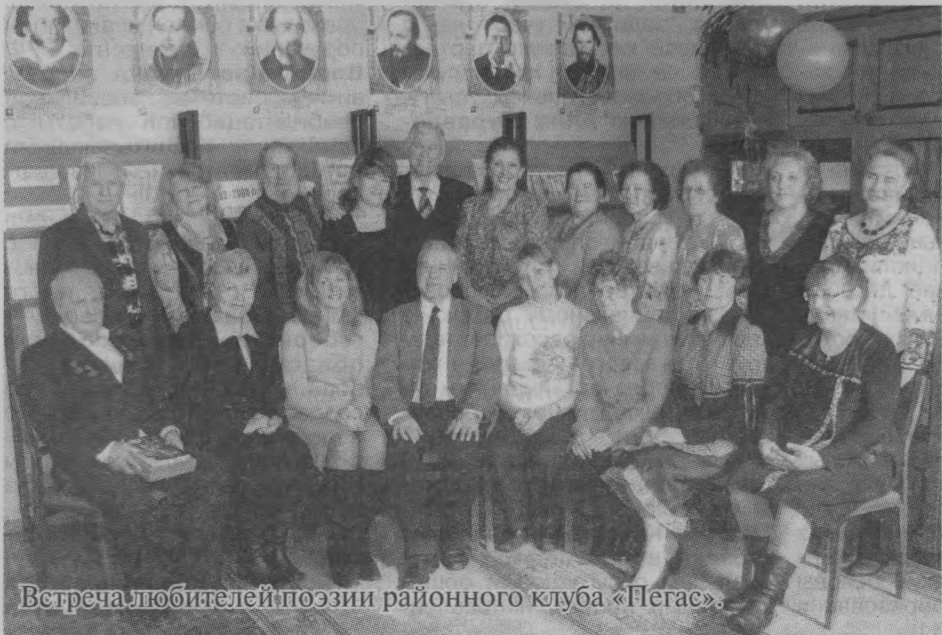
Встреча любителей поэзии районного клуба «Пегас».

- Ремонт дорожных покрытий по улицам поселка Тоншаево проводился в этом сезоне за счет участия в различных программах. Иными словами, на ремонт были привлечены средства областного и федерального бюджета. В районе успешно работает программа «Вам решать», планируется, что и в дальнейшем она будет финансироваться. Жители могут выйти с инициативой отремонтировать дорогу по их улице, собрать подписи и оставить заявку в администрации. Все заявки будут рассмотрены, а решение будет приниматься на сходе граждан.