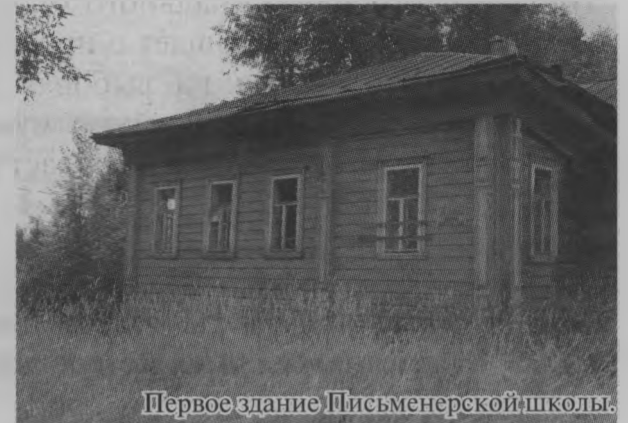
Первое здание Письменерской школы.