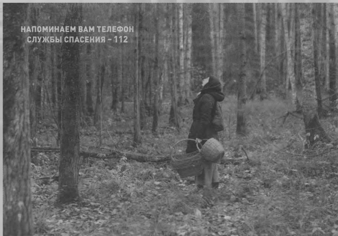
НАПОМИНАЕМ ВАМ ТЕЛЕФОН СЛУЖБЫ СПАСЕНИЯ – 112

Очень полезными могут оказаться высоковольтные линии. ЛЭП – это в первую очередь широкая просека. Если вы вышли к ЛЭП – иди-