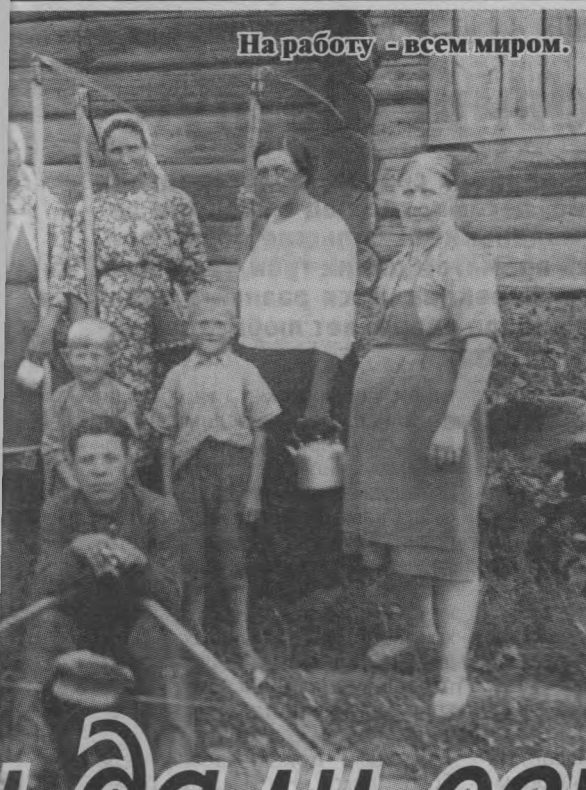
На работу - всем миром.