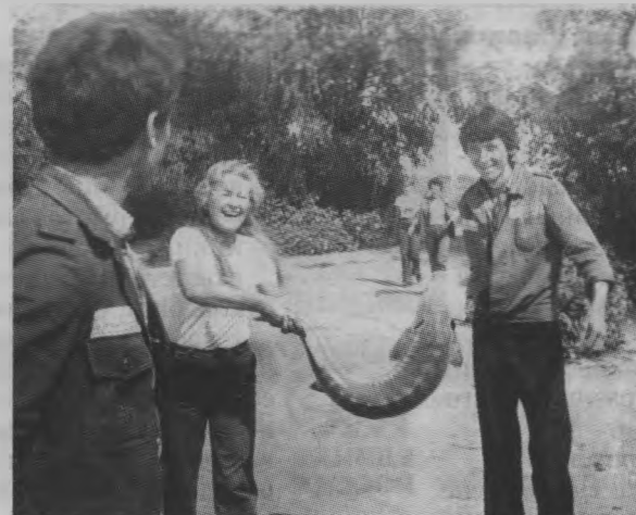
В стройотряде. Уха удалась на славу.

скромно, особо никто не выделялся, хотя «универ» – достаточно престижное учебное заведение. А на пятом курсе мы уже получали повышенную стипендию – 45 рублей.