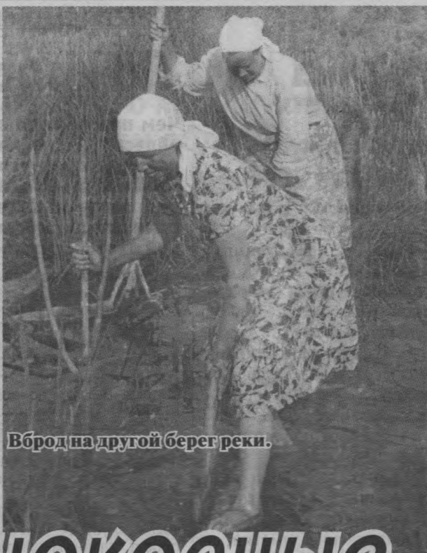
Вброд на другой берег реки.