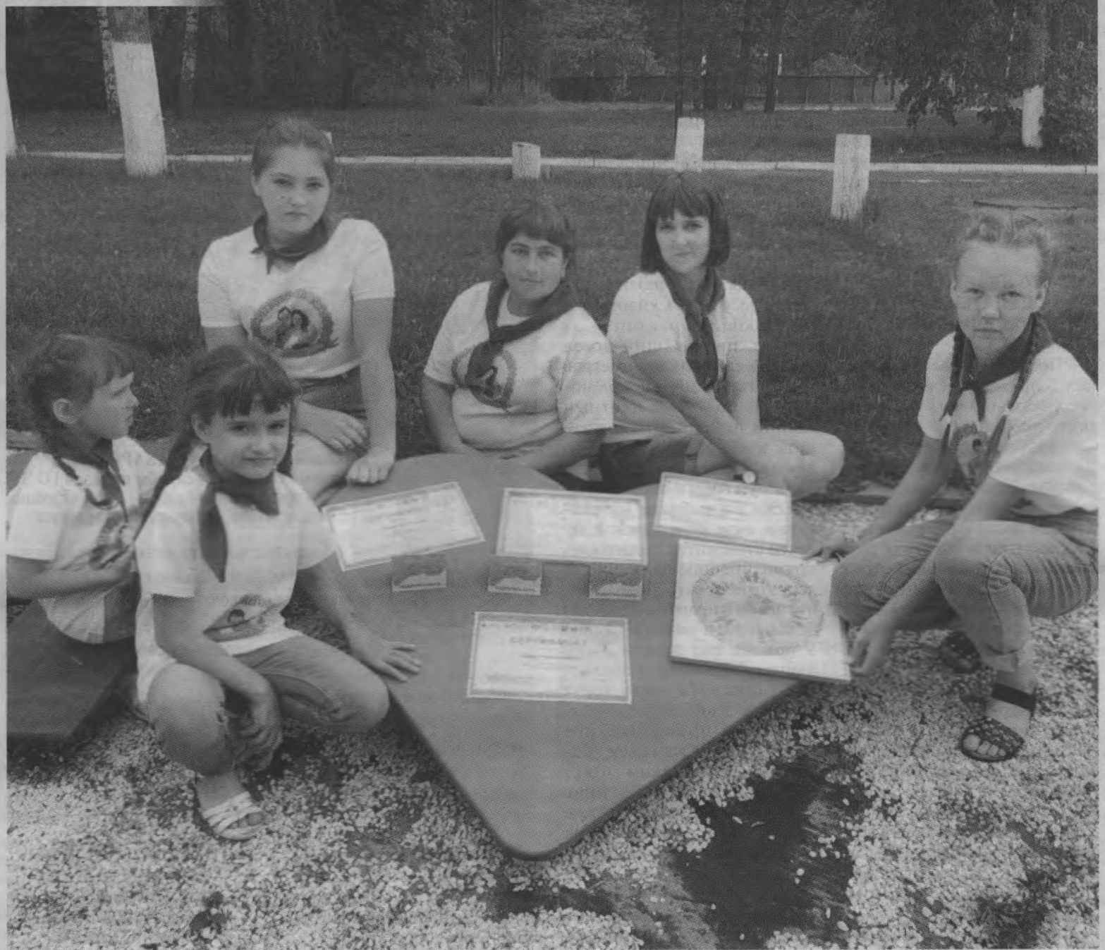
Клуб «Веселая семейка» с очередными наградами.