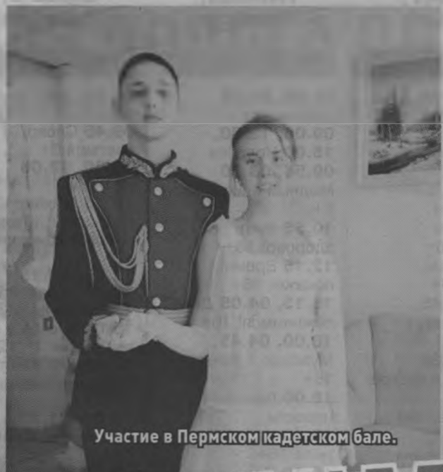
Участие в Пермском кадетском бале.