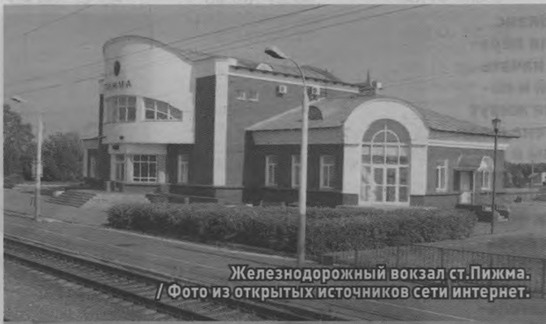
Железнодорожный вокзал ст.Пижма.

- На открытии вокзала у нас присутствовали не только гости из районной администрации, но и губернатор Нижегородской