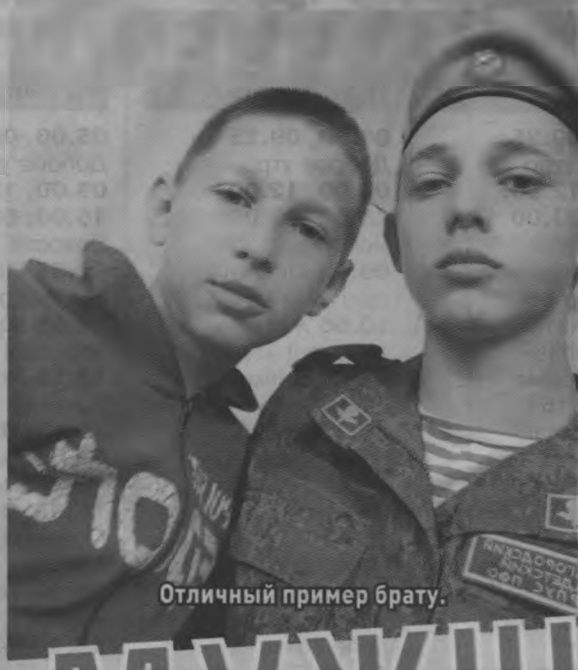
Отличный пример брату.