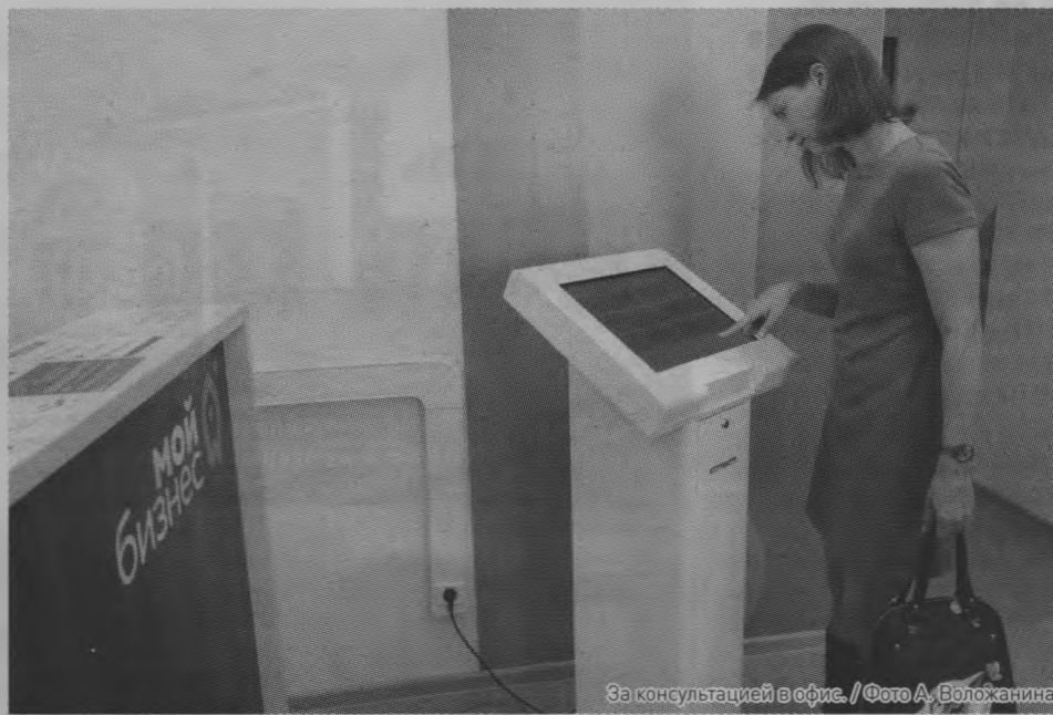
За консультацией в офисе.

Консультации участникам проекта готовы дать эксперты регионального и федерального уровней, в том числе с международным бизнес-опытом. В их числе