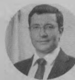
Глеб НИКИТИН, губернатор Нижегородской области:

- Медицинские учреждения, оказывающие специализированную помощь, переходят на плановый режим работы.