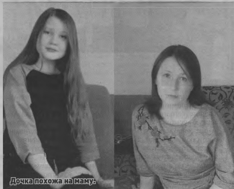
Дочка похожа на маму.

Всегда и во все времена именно семья была и остаётся местом, где тебе всегда рады, где тебя ждут, где обязательно поймут, и если нужно, помогут.