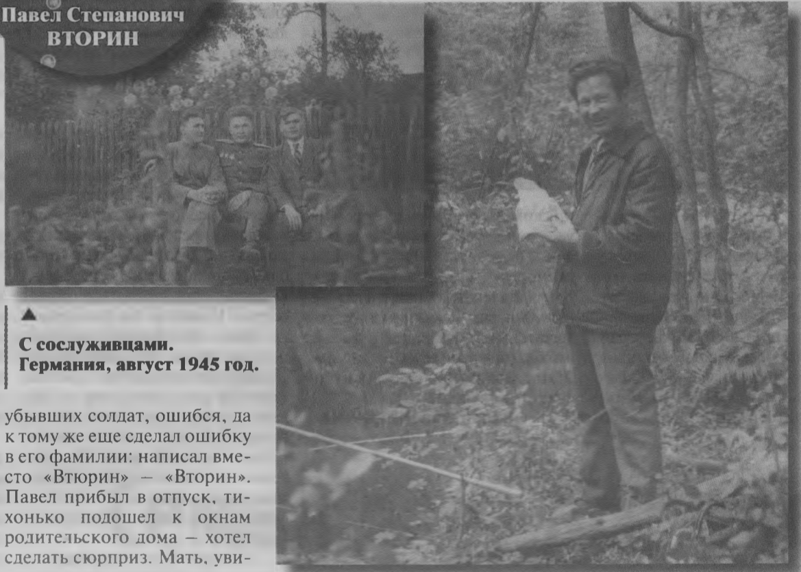
▲ С сослуживцами. Германия, август 1945 год.