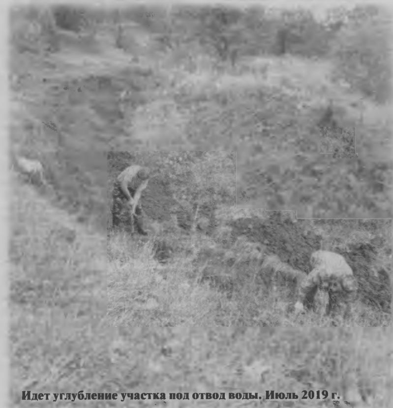
Идет углубление участка под отвод воды. Июль 2019 г.