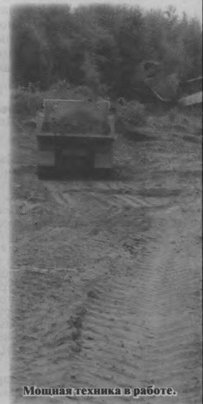
Мощная техника в работе.