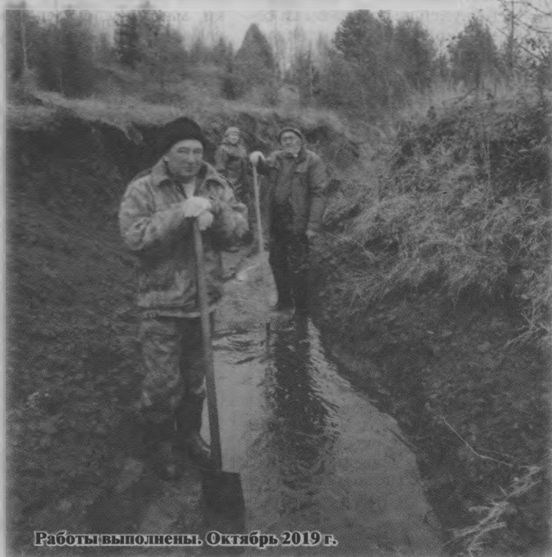
Работы выполнены. Октябрь 2019 г.