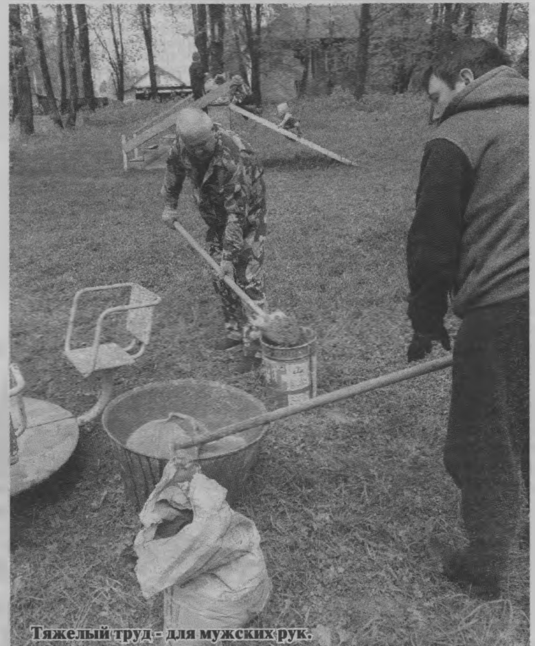
Тяжелый труд - для мужских рук.

Для площадки расчистили места намного больше, чем было, выкорчевали пеньки, убрали подгнившие деревянные детали паровозика. Машинку отремонтировали, а домик поставили на новое место. Своими руками смастерили из досок мотоцикл. Установили несколько спортивных лесенок и качелей.