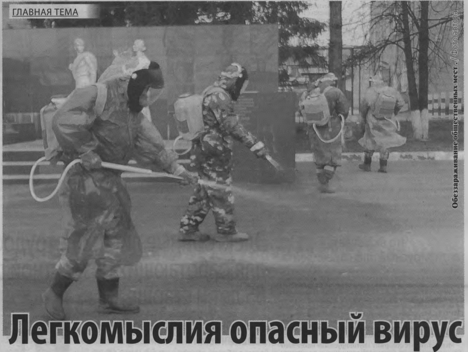
Обеззараживание общественных мест.