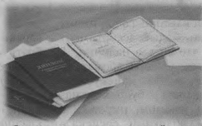
Осуществление индивидуальной предпринимательской деятельности

Прохождение профессиональной подготовки и переподготовки