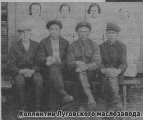
Коллектив Луговского маслозавода.

в основном женщины, вся тяжелая работа ложилась на их плечи. Завод работал в две смены, выпускали на нем казеин, который уходил на заводы, сливочное масло отправляли в Москву, в Кремль, а брынзу и сыр - на фронт. В те времена электричества не было, работали вручную при керосиновых лампах. Женщины крутили маслобойки, таскали тяжелые фляги с молоком, отгружали ящики с продукцией. Но никто не жаловался, все понимали, что солдатам на фронте приходится еще труднее.